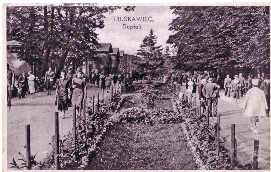
Ilustracja 1. Deptak Główny w Truskawcu