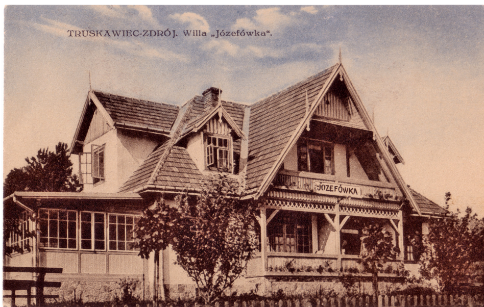
Ilustracja 2. Willa „Józefówka” – przykład budownictwa willowego w stylu zakopiańskim z okresu Polski międzywojennej