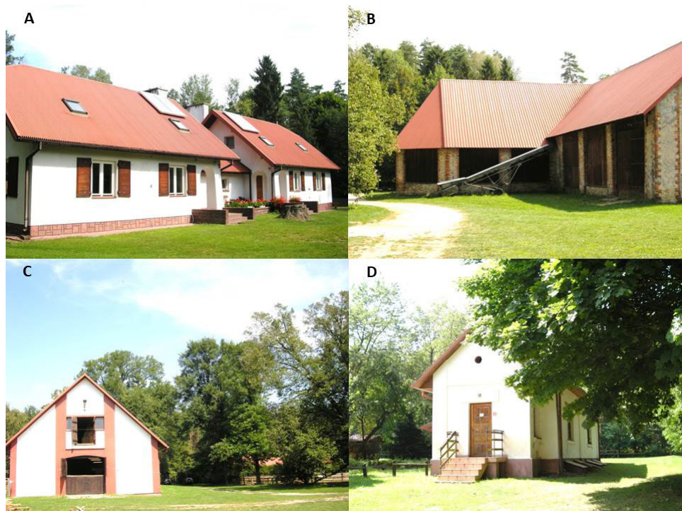
Ryc. 2. Zabudowania na terenie Ośrodka Hodowli Zachowawczej we Floriancie: A – leśniczówka; B – stodoła z menażem; C – stajnia; D – kancelaria OHZ

Założenie dworsko-ogrodowe we Floriancie położone jest w gminie Józefów, na terenie RPN. Obiekt leżący wśród lasów zwierzynieckich powstał w pierwszej połowie XIX w., prawdopodobnie w 1830 r. W drugiej połowie XIX w. założenie dworskie we Floriancie zostało zmodernizowane. Dwór-leśniczówkę rozbudowano, dodając część kuchenną, w efekcie czego rzut drewnianego dworu przyjął kształt litery T. Na polecenie ordynata Zamoyskiego na północ od dworu założono szkółkę leśną, która obfitowała w rzadkie na tych terenach odmiany i gatunki drzew. Na północny zachód od szkółki wśród lasów wykopano staw. W tym czasie aleja dojazdowa od strony Zwierzynca została obsadzona klonami i jaworami. Drogę dojazdową od strony Górecka obsadzono modrzewiami. Po obu stronach alei modrzewiowej założono sady. Administracja ordynacka utrzymywała się we Floriancie do 1945 r. Całość założenia przeszła wówczas w użytkowanie Nadleśnictwa Zwierzyniec. W latach powojennych Florianka uległa poważnemu zaniedbaniu. Poza rozbiórką