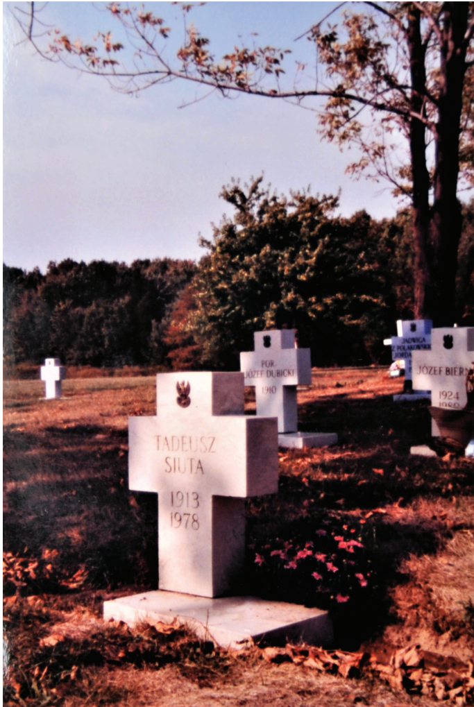
7. Grób Tadeusza Siuty