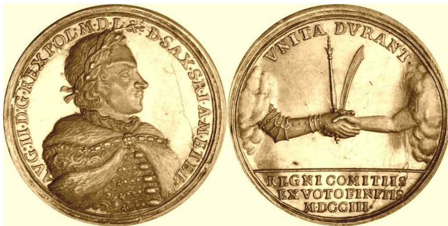
Ryc. 1. Medal wybity z okazji sejmu lubelskiego 1703 roku