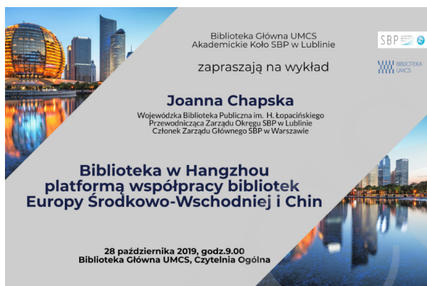
Fot. 4. Zaproszenie na wykład Joanny Chapskiej.