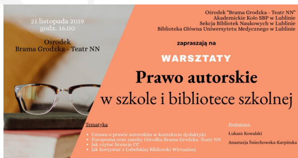
Fot. 5. Zaproszenie na warsztaty „Prawo autorskie”.

6. „Prawo autorskie w szkole i bibliotece szkolnej” – warsztaty odbyły się 21 listopada 2019 r. w godz. 16.00–18.00. Organizatorami byli: Teatr NN Ośrodek Brama Grodzka, Akademickie Koło SBP w Lublinie, Sekcja Bibliotek Naukowych SBP Oddział Lublin, Biblioteka Główna Uniwersytetu Medycznego w Lublinie. Warsztaty zgromadziły 37 uczestników (fot. 5).