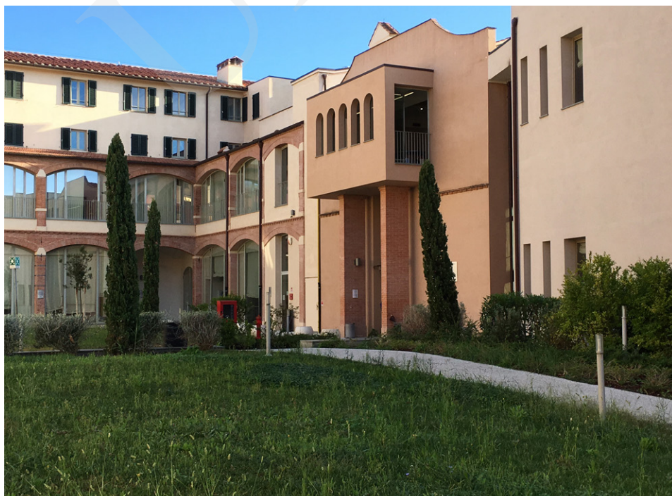
Fot. 1. Kompleks budynków POLO 6, fot. Ewa Rzeska.

Przemieszanie tradycji i nowoczesności charakterystyczne dla miasta oraz Uniwersytetu znajduje odzwierciedlenie w różnorodności architektonicznej i funkcjonalności Biblioteki Uniwersytetu w Pizie, która powstała i rozwijała się wraz z Alma Mater. Tworzy ją sieć specjalistycznych bibliotek tzw. POLO, powiązanych z poszczególnymi wydziałami: POLO 1: Rolnictwo (AGR), Ekonomia (ECO), Weterynaria (VET); POLO 2: Prawo (IUS), Nauki polityczne (SPO); POLO 3: Chemia (CHI), Matematyka, Informatyka, Fizyka (MIF), Nauki o ochronie środowiska (SNA); POLO 4: Medycyna, Chirurgia, Farmacja (MED); POLO 5: Inżynieria (ING); POLO 6: Kultura starożytna, językoznawstwo, germanistyka i sławistyka (ANT), Filologia angielska (LM2), Historia sztuki (STA), Filozofia i historia (FIL), Język i literatura romańska (LM1). Ponadto Uniwersytet posiada dwie biblioteki poza miastem: Nauk o turystyce (TUR) w Luce oraz Systemów Logistycznych (ELS) w Livorno. W Archiwum Głównym, które mieści się na peryferiach miasta, przechowywane są stare książki i dokumenty. W skład struktury Biblioteki wchodzi także Centrum Dokumentacji (CED), z którego mogą korzystać pracownicy naukowcy, studenci i pracownicy administracji uczelni. Wszystkie te jednostki funkcjonują w skoordynowanym systemie bibliotecznym, który nazywa się Sistema Bibliotecario di Ateneo, w skrócie SBA.