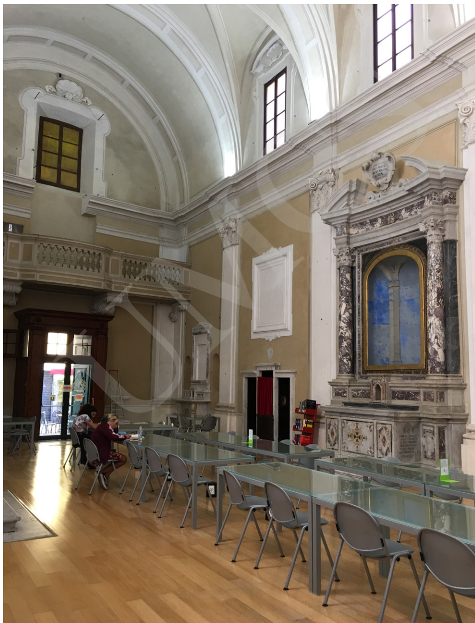
Fot. 3. Czytelnia biblioteki POLO 6.

W trzecim dniu pobytu zwiedziłyśmy bibliotekę POLO 4 (Biblioteka Medyczna), znajdującą się w pobliżu szpitala klinicznego. Zapoznaliśmy się z e-zasobami biblioteki (bazy danych, e-czasopisma, e-książki) oraz tworzonymi przez Bibliotekę