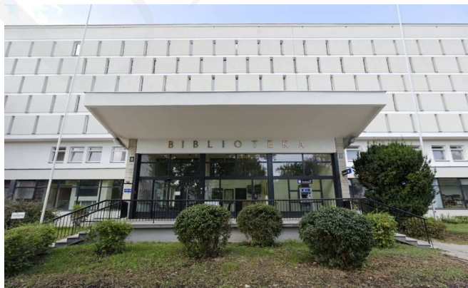
Fot. 1. Budynek Biblioteki Głównej UMCS.

Główną siedzibą Biblioteki od roku 1968 jest gmach przy w ul. Radziszewskiego 11, usytuowany w samym centrum kampusu, w bliskim sąsiedztwie budynków