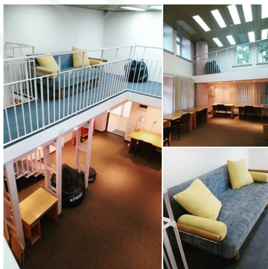
Fot. 3. Strefa relaksu i nauki w Bibliotece Głównej UMCS.