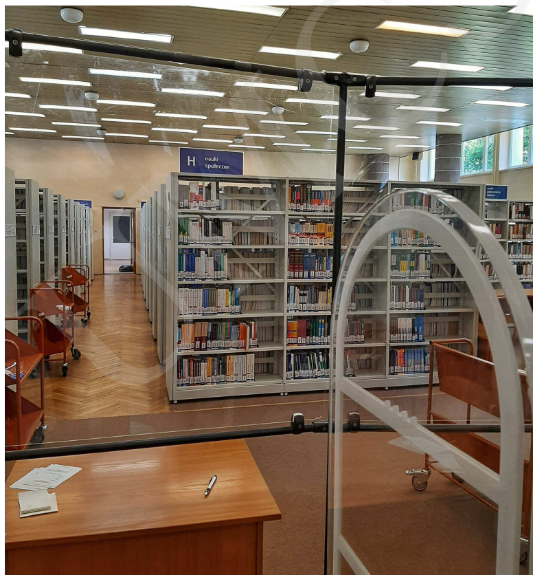
Fot. 2. Czytelnia 1 Wolnego Dostępu na parterze budynku Biblioteki UMCS.