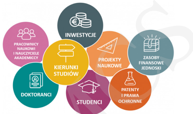
Rysunek 2. Obszary tematyczne Aplikacji POL-on.

Ogólnie w skład systemu wchodzi 40 modułów wyodrębnionych na podstawie obszarów tematycznych zaprezentowanych na rysunku 2.