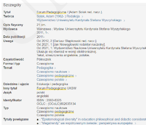
Ryc. 6. Zrzut ekranowy katalogu Biblioteki UMCS opartego na systemie PRIMO VE; Szczegóły pełnego widoku rekordu.

Modyfikacjom uległ również widok pełnego opisu rekordu, prezentowany w katalogu jako Szczegóły (ryc. 6). Menu konfiguracyjne PRIMO pozwala administratorom zarządzać prezentowanymi polami z poziomu rekordów bibliograficznych, dając im możliwość samodzielnego wyboru tych danych. Przekłada się to na wzbogacanie opisów o stosowane np. pola lokalne (ang. Local Fields ) w danej bibliotece, ewentualnie wzbogacenie tymi danymi paska faset (filtrów). Konfiguracja funkcji Manage display and local fields umożliwia po pierwsze zdefiniowanie reguł normalizacji używanych do wyświetlania informacji dla gotowych pól rekordu w formatach źródłowych MARC21, UNIMARC, np. autor, wydanie, język publikacji, format i typ oraz inne, których można używać do wyświetlania jako inne elementy opisu wyświetlanego dokumentu. Z kolei definiowanie pola lokalnego (ang. Local Fields ) polega na mapowaniu dodatkowych informacji z rekordu źródłowego. Pola te mogą być następnie wykorzystywane do rozszerzania zapytań wyszukiwania, filtrowania (faset) wyników wyszukiwania za pomocą wyświetlania dodatkowych informacji w skróconych i pełnych widokach rekordów. Mapowanie dotyczy pól MARC21 rekordu bibliograficznego z zakresu pól 009, 09X, 490, 5XX, 69X i 9XX.