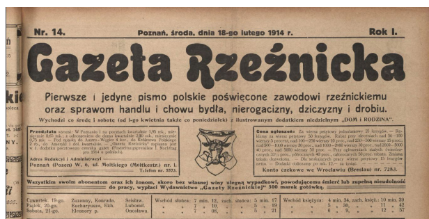
Ryc. 3.

Następny element winyety to informacje o częstotliwości. W pierwszym roczniku jest nieregularna – dwa razy w tygodniu: co środę i sobotą od numeru 1. do 19., trzy razy w tygodniu: co poniedziałek, środę i sobotą od numeru 20. do 76., ponownie dwa razy: co poniedziałek i czwartek w numerach 77. i 78. oraz co środę i sobotą od numeru 79. do 111. Numery od 104. do 107. pomimo oznaczenia: co środę i sobotą wydawane były 1 raz w tygodniu, w soboty. W tej części występuje informacja o dodatku niedzielnym „Dom i rodzina” w numerach: od numeru 2. (7 stycznia 1914) do numeru 69. (18 lipca 1914). Od numeru 72. brakuje dodatku niedzielnego. W 1918 r. gazeta była wydawana regularnie jako tygodnik co sobotę. Niżej zamieszczono dwie ramki z informacjami, po lewej stronie warunki przedpłat, adres redakcji i administracji, po prawej ceny ogłoszeń, rabaty stosowane przy ogłoszeniach większych i stałych oraz numer konta czekowego we Wrocławiu i Wiedniu. Pomiędzy ramkami znajduje się rysunek podobny do tego, który widnieje na pieczęci Cechu Rzeźników w Poznaniu: głowa byka na tle dwóch skrzyżowanych toporów, otoczony ramką. Pod nimi dwa ostatnie elementy występujące w pierwszym roczniku: informacja o ubezpieczeniu abonentów i ich rodzin oraz oddzielony kreską kalendarzyk z informacjami o imienninach, wschodach i zachodach słońca oraz księżycą na najbliższe dni, do następnego wydania.