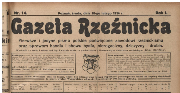
Ryc. 3. Ze zbiorów Biblioteki Głównej UMCS, fot. P. Kostko.

Następny element winyety to informacje o częstotliwości. W pierwszym roczniku jest nieregularna – dwa razy w tygodniu: co środę i sobotą od numeru 1. do 19., trzy razy w tygodniu: co poniedziałek, środę i sobotą od numeru 20. do 76., ponownie dwa razy: co poniedziałek i czwartek w numerach 77. i 78. oraz co środę i sobotą od numeru 79. do 111. Numery od 104. do 107. pomimo oznaczenia: co środę i sobotą wydawane były 1 raz w tygodniu, w soboty. W tej części występuje informacja o dodatku niedzielnym „Dom i rodzina” w numerach: od numeru 2. (7 stycznia 1914) do numeru 69. (18 lipca 1914). Od numeru 72. brakuje dodatku niedzielnego. W 1918 r. gazeta była wydawana regularnie jako tygodnik co sobotę. Niżej zamieszczono dwie ramki z informacjami, po lewej stronie warunki przedpłat, adres redakcji i administracji, po prawej ceny ogłoszeń, rabaty stosowane przy ogłoszeniach większych i stałych oraz numer konta czekowego we Wrocławiu i Wiedniu. Pomiędzy ramkami znajduje się rysunek podobny do tego, który widnieje na pieczęci Cechu Rzeźników w Poznaniu: głowa byka na tle dwóch skrzyżowanych toporów, otoczony ramką. Pod nimi dwa ostatnie elementy występujące w pierwszym roczniku: informacja o ubezpieczeniu abonentów i ich rodzin oraz oddzielony kreską kalendarzyk z informacjami o imienninach, wschodach i zachodach słońca oraz księżycy na najbliższe dni, do następnego wydania.