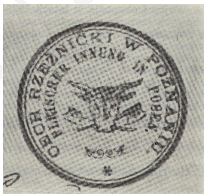
Ryc. 1. Pieczęć Cechu Rzeźników w Poznaniu z 1911 r. Ze zbiorów Biblioteki Głównej UMCS, fot. P. Kostko.

Rzeźnictwo, podobnie jak inne rzemiosła w Polsce, miało strukturę cechową. Dla każdej branży powstawał osobny cech. W dużych miastach było nawet kilkadziesiąt różnych cechów, istniały nieliczne cechy wielobranżowe. Pierwsza wzmianka o cechach rzeźnickich pochodzi z 1235 roku w Środzie Śląskiej. W Poznaniu początkowo istniały dwa cechy rzeźnicze, dwóch grup jatek: starszych murowanych i późniejszych drewnianych o nieustalonej dacie powstania. Pierwszy katalog cechów Poznania z 1440 r. wymienia już dwa cechy. Zjednoczenie obu nastąpiło w 1729 r., powstało „Bractwo Rzeźnicze Poznańskie Jatek Murowanych”, od 1796 r. znane jako „Bractwo Rzeźnicze Poznańskie”. Cech poznański w połowie XIX w. był największym cechem w Polsce liczącym od 272 do 305 członków. Przez cały okres utraty niepodległości w dokumentach cechowych posługiwano się językiem polskim, dopiero od 1880 r. protokoły sprawozdawcze były dwujęzyczne: polskie i niemieckie. Podobnie pieczęć cechu miała napis w dwóch językach. Symbolem organizacyjnej jedności cechu była skrzynia cechowa, w której przechowywano ważniejsze dokumenty oraz pieczęć, łańcuch, buzdygan (berło) i sztandar 14 .