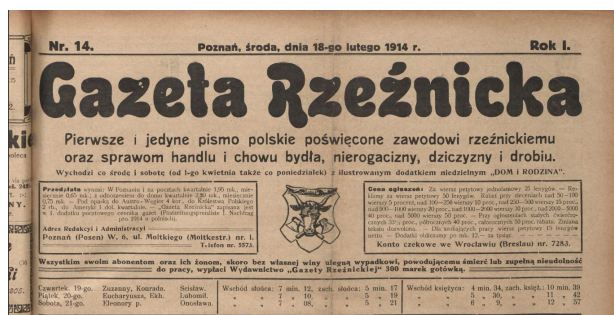
Ryc. 3.

Następny element winyety to informacje o częstotliwości. W pierwszym roczniku jest nieregularna – dwa razy w tygodniu: co środę i sobotą od numeru 1. do 19., trzy razy w tygodniu: co poniedziałek, środę i sobotą od numeru 20. do 76., ponownie dwa razy: co poniedziałek i czwartek w numerach 77. i 78. oraz co środę i sobotą od numeru 79. do 111. Numery od 104. do 107. pomimo oznaczenia: co środę i sobotą wydawane były 1 raz w tygodniu, w soboty. W tej części występuje informacja o dodatku niedzielnym „Dom i rodzina” w numerach: od numeru 2. (7 stycznia 1914) do numeru 69. (18 lipca 1914). Od numeru 72. brakuje dodatku niedzielnego. W 1918 r. gazeta była wydawana regularnie jako tygodnik co sobotę. Niżej zamieszczono dwie ramki z informacjami, po lewej stronie warunki przedpłat, adres redakcji i administracji, po prawej ceny ogłoszeń, rabaty stosowane przy ogłoszeniach większych i stałych oraz numer konta czekowego we Wrocławiu i Wiedniu. Pomiędzy ramkami znajduje się rysunek podobny do tego, który widnieje na pieczęci Cechu Rzeźników w Poznaniu: głowa byka na tle dwóch skrzyżowanych toporów, otoczony ramką. Pod nimi dwa ostatnie elementy występujące w pierwszym roczniku: informacja o ubezpieczeniu abonentów i ich rodzin oraz oddzielony kreską kalendarzyk z informacjami o imieninach, wschodach i zachodach słońca oraz księżycą na najbliższe dni, do następnego wydania.