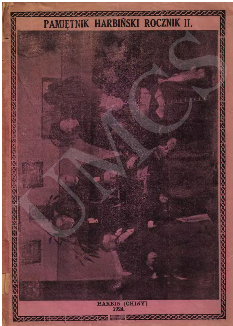
Fot. 4. 1924.