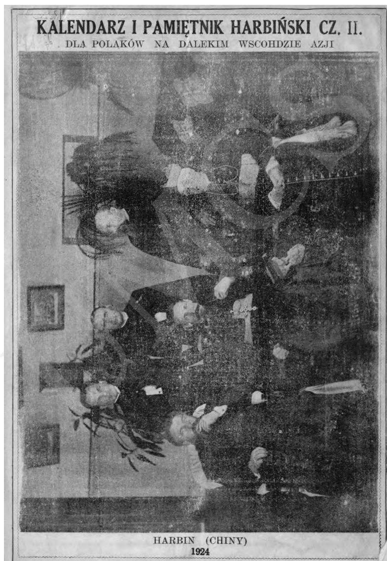
Fot. 3.

Żaden spis czasopism harbińskich, jak również bardzo wyczerpująca bibliografia Adama Winiarza nie wymieniają pozycji „Kalendarz dla Polaków na Dalekim Wschodzie”, „Kalendarz dla Polaków na Dalekim Wschodzie i Pamiętnik Charbiński” czy „Kalendarz i Pamiętnik Harbiński dla Polaków na Dalekim Wschodzie Azji”, stąd nie sposób obecnie stwierdzić, skąd wynikały różnice w poszczególnych wydaniach.