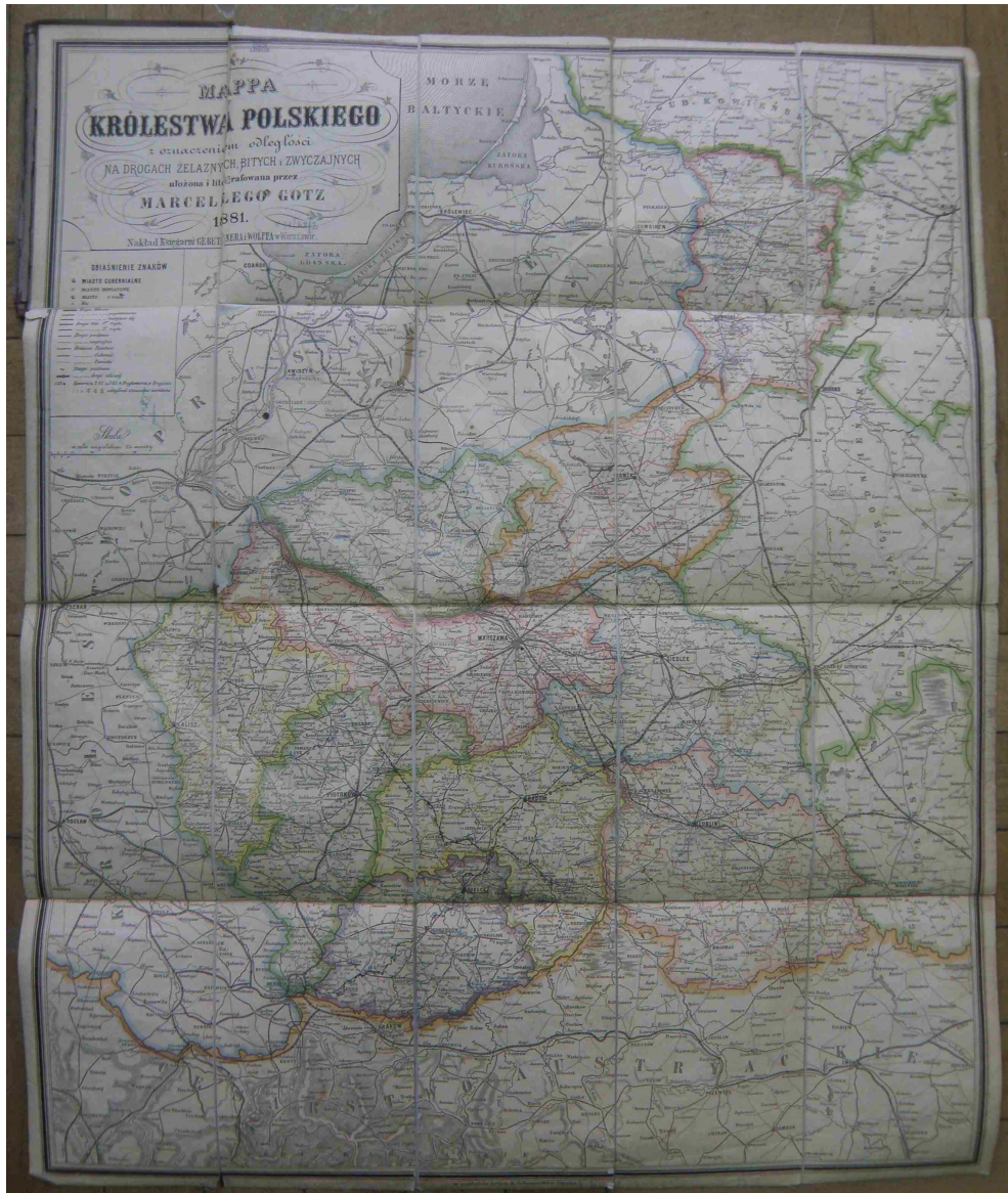
Fot. 4. Mapa Królestwa Polskiego z oznaczeniem odległości na drogach żelaznych, bitych i zwyczajnych, ułożona i litografowana przez Marcellego Gotza