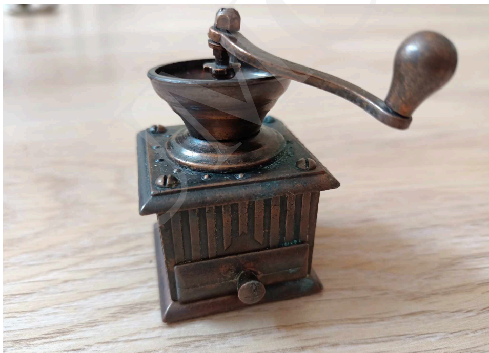
Fot. 1. Wystawa „Małeńkie cudenka – niezwykła pasja kolekcjonera temperówek” w holu Biblioteki Głównej UMCS w Lublinie.

Właścicielką przedstawionych eksponatów oraz prezentowanych zdjęć jest pani Alicja Juszcak, nauczycielka na co dzień pracująca w Prywatnej Szkole Podstawowej im. Królowej Jadwigi w Lublinie. Od 18 lat kolekcjonuje temperówki, które mają kształty różnych przedmiotów codziennego użytku: miniatur militariów, instrumentów muzycznych, pojazdów czy budynków. Co ciekawe, każdy z tych przedmiotów posiada ruchome elementy: otwierane szuflady i drzwiczki czy pokrętła i korbki. Przepiękne unikatowe temperówki o doskonale odwzorowanych detalach wykonano z niezwykłą precyzją szczegółów. Obecnie kolekcja liczy 187 sztuk i nadal jest powiększana. Głównie są to pamiątki przywożone z podróży po różnych krajach.