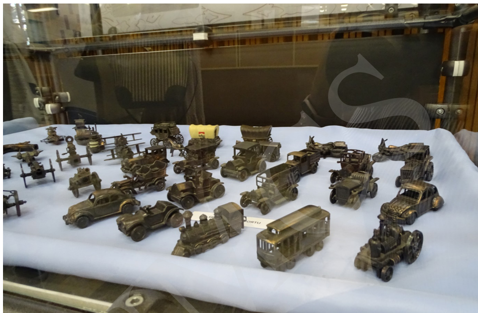
Fot. 4. Wystawa „Malańkie cudenka – niezwykła pasja kolekcjonera temperówek” w holu Biblioteki Głównej UMCS w Lublinie.