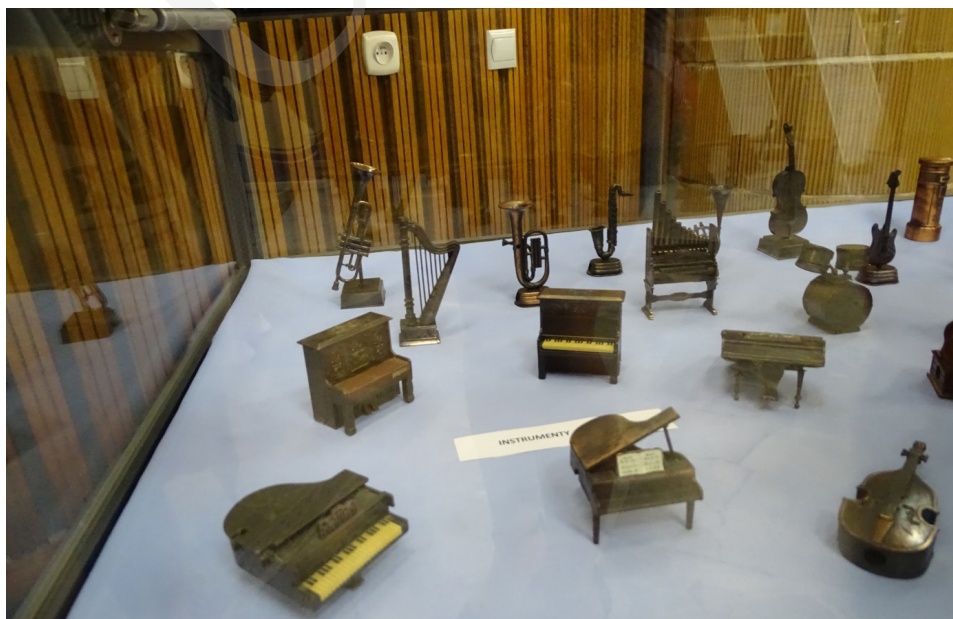
Fot. 5. Wystawa „Malańkie cudenka – niezwykła pasja kolekcjonera temperówek” w holu Biblioteki Głównej UMCS w Lublinie.