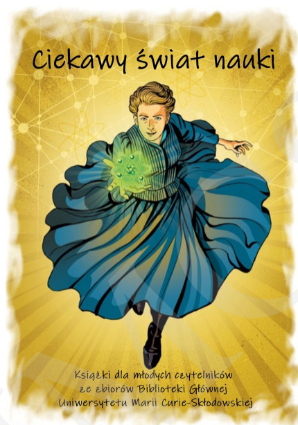
Fot. 1. Plakat reklamujący wystawę, autorstwa I. Mielniczuk i M. Zawady, zamieszczony na witrynie internetowej BG UMCS oraz ustawiony na wejściu przed wystawą.

Książki zaprezentowano na stołach i mobilnych ekspozytorach w kilku blokach tematycznych, np. astronomia, medycyna, historia itp. Przy każdym przygotowano tablice z ciekawymi informacjami oraz postaciami ze świata nauki. Uzupełnieniem prezentowanych pozycji książkowych był stary sprzęt techniczny w postaci dwóch telefonów tarczowych oraz maszyn do pisania. Dla odwiedzających przygotowano strefę relaksu, w której można było odpocząć i poczytać. Obok znajdował się kącik plastyczny, w którym najmłodszy odwiedzający mieli możliwość uwiecznienia wrażeń z wystawy. Pozostawione przez nich dzieła były prezentowane na specjalnej tablicy umieszczonej obok wystawy.