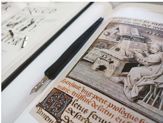
Fot. 1. Przykłady iluminacji i tradycyjnych materiałów piśmienniczych, fot. A. Mikulska.

W dniach 18–24 września 2023 roku Uniwersytet Marii Curie-Skłodowskiej w Lublinie aktywnie włączył się w organizację Lubelskiego Festiwalu Nauki. Dziewiętnasta edycja wydarzenia osiągnęła rekordowe wyniki pod względem zgłoszonych projektów – aż 1758 wydarzeń, prezentacji i warsztatów. Zgromadziła