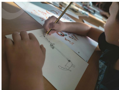
Fot. 6 . Projektowanie inicjału, fot. A. Mikulska.

Bogactwo fantazyjnych inicjałów oraz wibrujących kolorem wielobarwnych bordiur zainspirowało do działań twórczych uczestników warsztatów kreatywnych, przygotowanych w Oddziale Zbiorów Specjalnych dla zorganizowanych grup szkolnych.