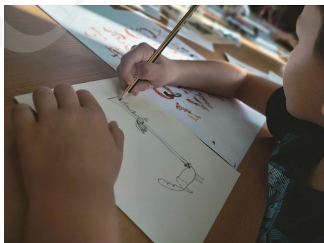
Fot. 6 . Projektowanie inicjału, fot. A. Mikulska.

Bogactwo fantazyjnych inicjałów oraz wibrujących kolorem wielobarwnych bordiur zainspirowało do działań twórczych uczestników warsztatów kreatywnych, przygotowanych w Oddziale Zbiorów Specjalnych dla zorganizowanych grup szkolnych.