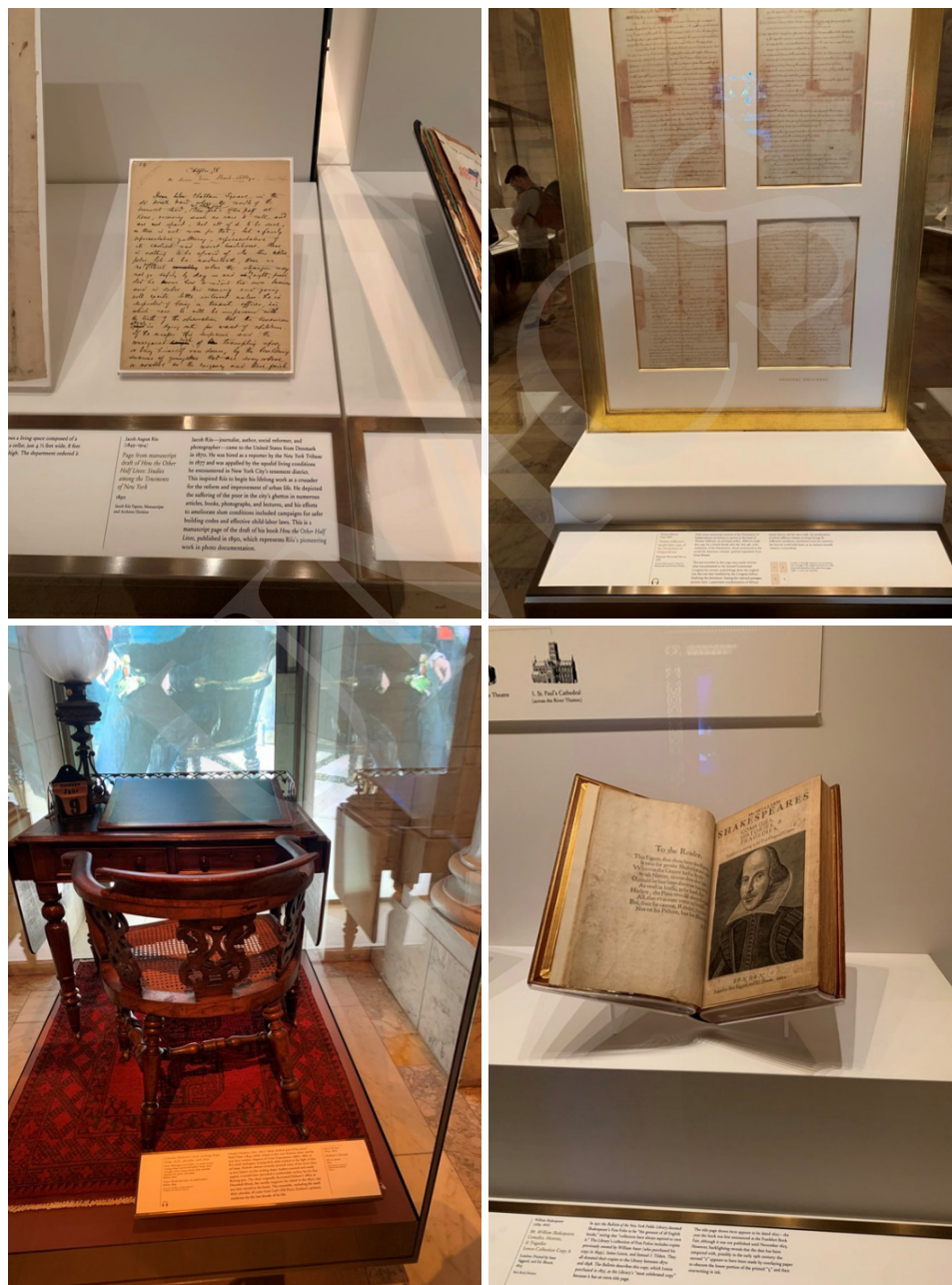
Fot. 6. Zbiory Nowojorskiej Biblioteki, fot. A. Strumińska.

W zbiorach Nowojorskiej Biblioteki Publicznej znajduje się wiele cennych dzieł, takich jak: Biblia Gutenberga czy rękopis Deklaracji Niepodległości napisany przez