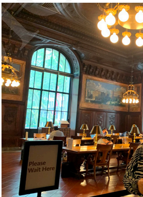
Fot. 5. Czytelnia Biblioteki

Biblioteka ma również ofertę dla najmłodszych. W podziemiach budynku znajduje się czytelnia dla dzieci. Wejścia do niej chroni lew wykonany z klocków lego. Najważniejszym eksponatem tej części biblioteki są pluszaki. Od 1987 roku w Nowojorskiej Bibliotece mieszka Kubuś Puchatek i jego przyjaciele: Prosiaczek, Kłapouchy, Kangurek i Tygrysek. Jak się dowiedziałam, to oryginalne maskotki małego chłopca Christopa Robina Milne, które stały się inspiracją dla jego Taty – Alana A. Milne do napisania najsłynniejszej i najpiękniejszej na świecie książki dla dzieci.