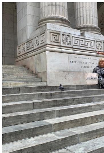
Fot. 1. The New York Library, fot. A. Strumińska.