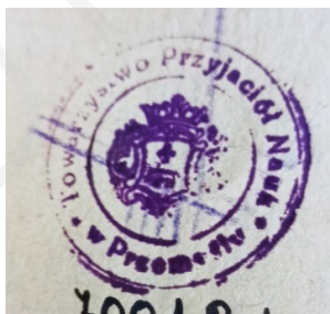
Ryc. 7. Pieczętka biblioteczna Towarzystwa Przyjaciół Nauk w Przemysłu.

Kolejnym znalezionym znakiem własnościowym jest pieczętka Księgarni Arctów w Lublinie (1838–1933) – rodzinnej firmy wydawniczo-księgarskiej rodu Arctów. Księgarnia została założona przez Stanisława Arcta 21 w Lublinie w 1836 r. 22 Jednocześnie z otwarciem księgarni, w celach dochodowych Arct uruchomił wypożyczalnię książek. Początkowo oferowała ona ponad 4 tys. aktualnych polskich tytułów i około 1,2 tys. francuskich, po kilku latach została poszerzona o szeroko promowaną literaturę dziecięcą i młodzieżową 23 . Klienci mieli możliwość dokonywania zakupów bezpośrednio w księgarni lub drogą wysyłkową 24 . Od 1852 r. przedsiębiorstwo S. Arcta przestało być tylko księgarnią, pojawiły się pierwsze książki wydane przez jego oficynę. Prowadzenie wydawnictwa przejął bratanek Michał Arct, który w 1881 r. objął rodzinny interes i przeniósł go do Warszawy 25 . Działalność wydawnictwa była kontynuowana przez jego potomków, a w 1922 r. firma została przekształcona w spółkę akcyjną. Po wojnie Jerzy Arct postanowił reaktywować rodzinny biznes, który działał do 1953 r. jako Księgarnia Arcta 26 .