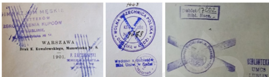
Ryc. 3. Przykłady anulacji pieczętek.

Odcisk tuszowy pieczętki można łatwo usunąć za pomocą odpowiednich odczynników chemicznych, w przeciwieństwie do odbitej farbą drukarską czy wykonanej przy użyciu suchego tłoku. Spotyka się też przypadki dewastacji pieczętek przez usunięcie fragmentu strony, na której się znajdowała, jej wycięcia czy zamazania ciemnym tuszem lub innym środkiem uniemożliwiającym odczytanie, a także nałożenie – odbicie nowej pieczętki na już istniejącą (ryc. 4).