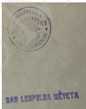
Ryc. 9. Pieczęćki Leopolda Méyeta.

Na swojej stronie internetowej Muzeum poszukuje wszelkich informacji i pamiątek związanych z rodziną Oborskich, w tym także książek, które znajdowały się w bibliotece rodziny 33 (można je rozpoznać po pieczętce). Obecnie w zbiorach mieleckiego Muzeum znajduje się jedynie kilkanaście książek pochodzących z rodzinnej biblioteki Oborskich.