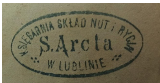
Ryc. 6. Pieczęćka firmy wydawniczo-księgarskiej Stanisława Arcta.

Waław Bajkowski był wybitnym polskim prawnikiem i społecznikiem, który pełnił funkcję prezydenta Lublina w latach 1916–1918 20 . Urodził się 31 grudnia 1875 r. we wsi Włostowice koło Puław. Po studiach prawniczych na Uniwersytecie Warszawskim w 1903 r. rozpoczął aplikację adwokacką w Lublinie, specjalizując się w prawie cywilnym. Oprócz pracy zawodowej angażował się również w działalność publiczną i samorządową, był jednym z organizatorów sądownictwa obywatelskiego w Lublinie. Na jego wniosek Rada Miejska z okazji 600-lecia nadania Lublinowi praw miejskich uchwaliła, by placowi przed Magistratem nadać imię króla Władysława Łokietka oraz zażądać zwrotu wywiezionych do Wilna najstarszych zasobów archiwalnych ziemi lubelskiej i Podlasia. W 1940 r. został zatrzymany przez Gestapo, wywieziony do obozów koncentracyjnych Sachsenhausen i Dachau, gdzie 11 kwietnia 1941 r. zginął. W uznaniu zasług Waława Bajkowskiego w 2009 r. ulica przy gmachu Ratusza (wcześniej ul. Przystankowa) została nazwana jego imieniem.