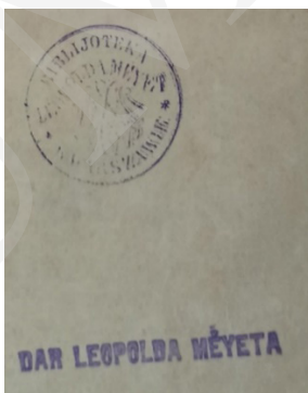
Ryc. 9. Pieczęćki Leopolda Méyeta.

Na swojej stronie internetowej Muzeum poszukuje wszelkich informacji i pamiątek związanych z rodziną Oborskich, w tym także książek, które znajdowały się w bibliotece rodziny 33 (można je rozpoznać po pieczętce). Obecnie w zbiorach mieleckiego Muzeum znajduje się jedynie kilkanaście książek pochodzących z rodzinnej biblioteki Oborskich.