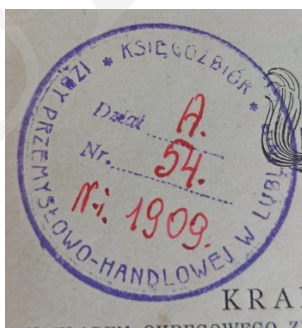
Ryc. 10. Pieczęta Biblioteki Izby Przemysłowo-Handlowej w Lublinie.

Leopold Méyet to polski teoretyk prawa, adwokat i literat, a także bibliofil i filantrop 35 . Urodził się w Warszawie w 1850 r. w zamożnej, kupieckiej rodzinie żydowskiej. Był jednym z największych kolekcjonerów rozmaitych pamiątek, dzieł sztuki, stylowych mebli, bibelotów i zegarów. Szczególnie upodobał sobie okres romantyzmu, gromadził dzieła sztuki po narodowych wieszczach. Był posiadaczem ogromnego zbioru książek i starodruków, zbioru 450 ekslibrisów, a także unikalnego zbioru autografów i fotografii wszystkich pisarzy polskich z ostatnich dziesięciu lat XIX stulecia 36 oraz cennej kolekcji starych fotografii. Część swoich zbiorów oraz 1,5 tysiąca rubli przekazał testamentem w 1911 r. Muzeum Miejskiemu w Warszawie, skąd później trafiły do Muzeum Narodowego, a w 1955 r. zostały przekazane do Muzeum Literatury; część ksiąg przekazał warszawskiej bibliotece Towarzystwa Prawniczego, Warszawskiemu Towarzystwu Muzycznemu; wiele rękopisów, fotografii i książek – Bibliotece Ordynacji Krasieńskich; niektóre eksponaty darował Muzeum Adama Mickiewicza przy Bibliotece Polskiej w Paryżu 37 . Zmarł w 1912 r. w Warszawie.