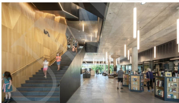
Fot. 8. Missoula Public Library.

Kolejną biblioteką stworzoną z myślą o przyszłych czytelnikach jest amerykańska biblioteka publiczna Missoula, która w 2022 r. otrzymała nagrodę dla najlepszej biblioteki (Public Library of the Year Award) przyznawaną przez Międzynarodową