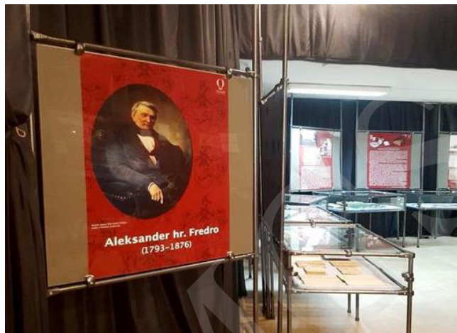
Fot. 6. Wystawa Aleksander hr. Fredro – polski Molière. W 230. rocznicę urodzin.