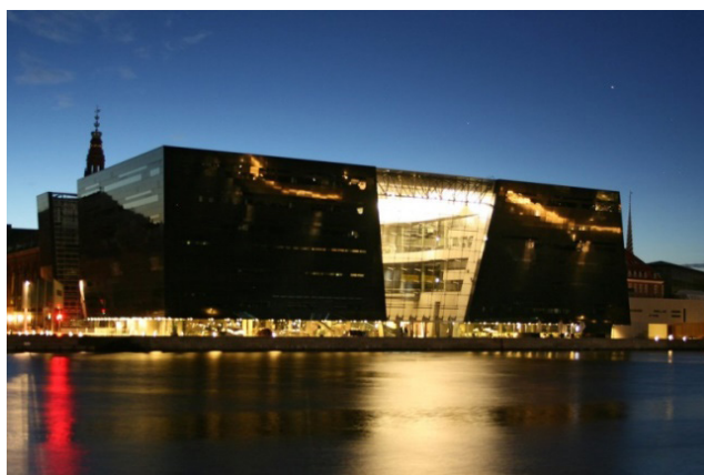
Fot. 7. Biblioteka Królewska w Kopenhadze.

W XXI w. nowo wybudowane budynki biblioteczne stały się przykładami nowoczesności, łącząc tradycyjne funkcje z innowacyjnymi rozwiązaniami technologicznymi i architektonicznymi. Jedną z najnowocześniejszych bibliotek w Europie jest Biblioteka Królewska w Kopenhadze powszechnie nazywana „Czarny Diament” ze względu na charakterystyczną elewację z czarnego granitu. Budynek znajduje się