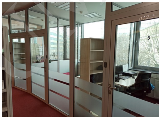
Fot. 1. Pokoje do pracy indywidualnej i grupowej – Biblioteka Uniwersytetu Przyrodniczego Lublin.

sale multimedialne, sale konferencyjne, laboratoria, centra dydaktyczne, kawiarnie czy miejsca relaksu. „Architektura biblioteczna [...], coraz częściej odchodzi od sztywnych podziałów na czytelnie, wypożyczalnię, ale stara się zapewnić przyjazne miejsce do pracy, nauki, odpoczynku, kontaktów społecznych” 13 . Budynki biblioteczne w swoich murach oferują ciekawe miejsca, w których warto przebywać 14 , gdzie można przyjść i miło spędzić czas. Osoba przychodząca do biblioteki nie musi być jej czytelnikiem i korzystać ze zbiorów, może wykorzystać specjalne przestrzenie do relaksu, spotkać się, porozmawiać ze znajomymi, napić się kawy. Użytkownikom biblioteka powinna kojarzyć się z miejscem przyjaznym, dającym poczucie bezpieczeństwa, zachęcającym do spotkań 15 . Współczesne biblioteki są wielofunkcyjne, oferują swoim czytelnikom miejsca nauki, edukacji, kultury, spotkań czy innych form działania 16 . Znajdują się tam strefy nauki, relaksu czy odpoczynku, gdzie można usiąść na pufie czy hamaku i cieszyć się książką. Dla najmłodszych są miejsca zabaw z kryjówkami do chowania się. Jeżeli potrzebujesz miejsca do spotkania ze znajomymi, do tego również jest biblioteka 17 .