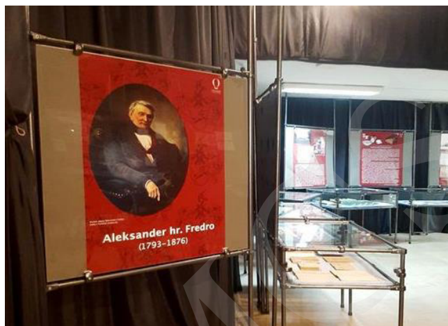
Fot. 6. Wystawa Aleksander hr. Fredro – polski Molière. W 230. rocznicę urodzin.