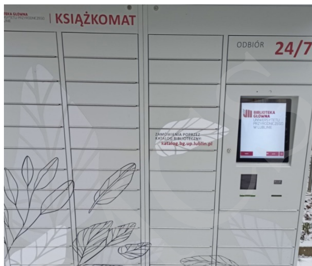
Fot. 13. Książkomat Biblioteki Uniwersytetu Przyrodniczego w Lublinie.