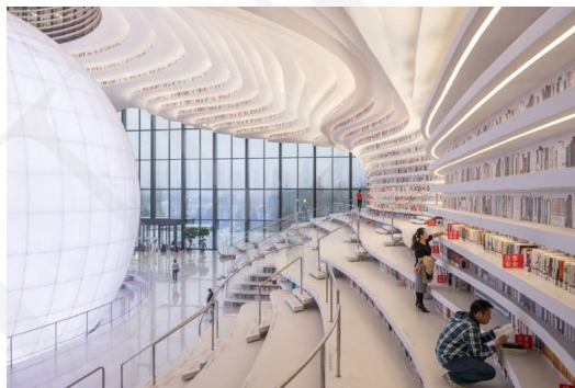
Fot. 11. Biblioteka Binhai w Tianjin, fot. Ossip van Duivenbode. Źródło: https://www.bryla.pl/bryla/7,85298,22639247,futurystyczna-biblioteka-w-chinach-od-mvrdrv.html .

Przykłady te pokazują, jak bardzo innowacyjne potrafią być budynki biblioteczne łączące funkcjonalną architekturę, estetykę i zaawansowaną technologię. Widoczne jest tworzenie miejsc przyjaznych czytelnikowi, sprzyjających nauce i integracji społecznej. Biblioteki tym samym odpowiadają na zmieniające się potrzeby społeczeństwa i rozwój technologiczny.