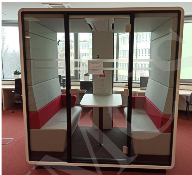
Fot. 2. Kabina multimedialna – Biblioteka Uniwersytetu Przyrodniczego Lublin.

Biblioteki w XXI w. na nowo definiują swoje funkcje w odpowiedzi na zmieniające się potrzeby użytkowników i rozwój techniki. Jej rola nie ogranicza się już tylko do zbierania i udostępniania książek, lecz obejmuje także bycie centrum innowacji, edukacji i integracji społecznej. Biblioteki stały się instytucjami świadczącymi usługi na rzecz swoich czytelników 18 , których potrzeby sprawiają, że biblioteka staje się miejscem pełnym kulturalnym wydarzeń. Dziś biblioteka to także czytelnicy, spotkania oraz integracja. Zainteresowaniem czytelników cieszą się festiwale książek, spotkania miłośników komiksów, spotkania z autorami, miłośników literatury, wykłady czy warsztaty. W Bibliotece Głównej UMCS w Lublinie organizowane są różne wydarzenia kulturalne, tj.: spotkania z mangą i anime dla miłośników komiksów, spotkania miłośników literatury, wykłady Stowarzyszenia Miłośników Dawnej Broni i Barwy, wieczorki poetyckie, warsztaty dla dzieci.