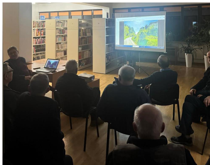
Fot. 5. Wykład Stowarzyszenia Miłośników Dawnej Broni i Barwy.