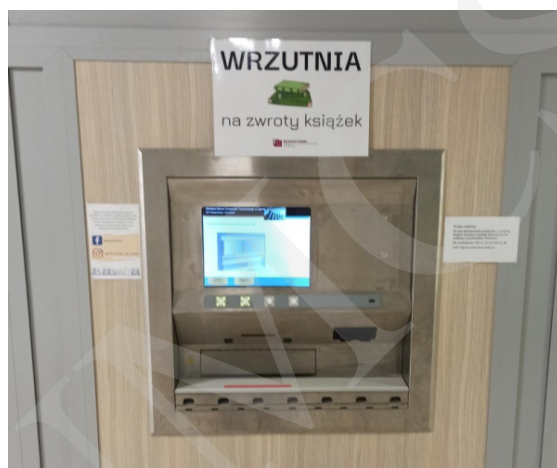
Fot. 12. Wrzutnia Biblioteki Uniwersytetu Przyrodniczego w Lublinie.

większej ilości informacji niż przy tradycyjnych kodach. Etykiety RFID umożliwiają odczytanie danych bez konieczności ściągnięcia książki z regału, lokalizują źle odłożone egzemplarze oraz zabezpieczają przed kradzieżą. System automatycznej identyfikacji RFID zapewnia szybsze i wydajniejsze zarządzanie zbiorami bibliotecznymi.