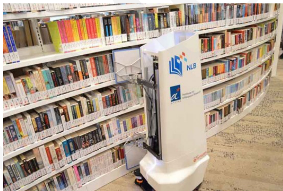
Fot. 14. Robot AuRoSS.

Rozwój technologii ma za zadanie ułatwienie pracy. Do czasochłonnych prac wykonywanych w bibliotece, takich jak inwentaryzacja czy weryfikacja tego, czy książka znajduje się we właściwym miejscu na regale, wykorzystuje się roboty magazynowe. Przykładem takiego robota jest wynaleziony przez singapurskich naukowców AuRoSS ( Autonomous Robotic Shelf Scanning System ). Robot ten samodzielnie przemieszcza się między regałami bibliotecznymi i wykorzystując technologię RFID, skanuje książki, następnie generuje raport o brakujących lub źle odłożonych pozycjach. Według badań robot ten osiągnął poziom dokładności wynoszący 99% 28 .