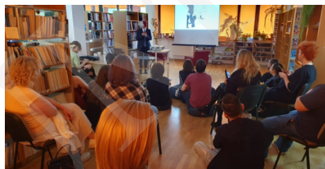
Fot. 4. Spotkania z mangą i anime.