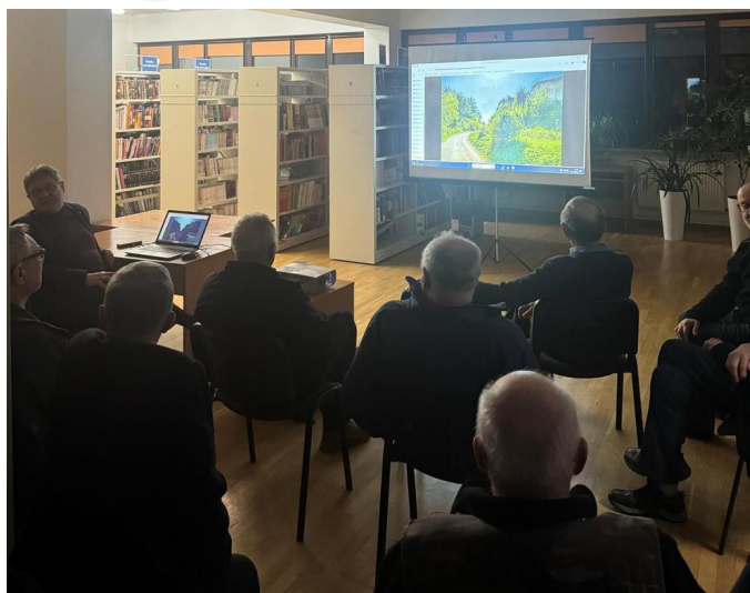
Fot. 5. Wykład Stowarzyszenia Miłośników Dawnej Broni i Barwy.