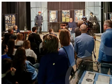
Fot. 3. Wernisaż wystawy „Szembekowie i Fredrowie w Dziejach Polski”.