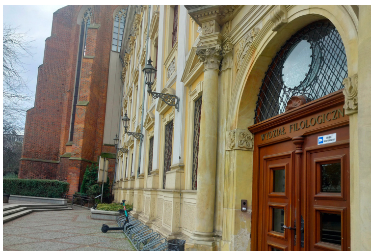
Fot. 1. Wydział Filologiczny UW.

Kongres ten jest wydarzeniem cyklicznym i kontynuuje tradycję gdańsko-wrocławskiej debaty nad drukami ulotnymi. Biorą w nim udział przedstawiciele różnych dyscyplin naukowych, np. historii, nauk socjologicznych, literaturoznawstwa, językoznawstwa, nauk o komunikacji społecznej i mediach, oraz pracownicy muzeów, bibliotek i archiwów.