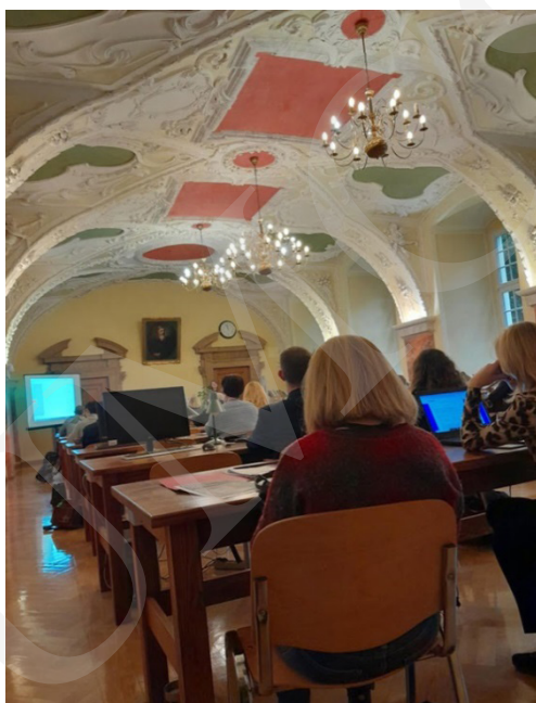
Fot. 9. Prezentacja jednego z wystąpień.

króla, „wziąć pod rękę Marsa, by wspomagać go w lepszych czasach”. Tło polityczne stanowił powrót Króla Zygmunta III Wazy z podróży do Szwecji, a wątki poruszane w poemacie są odwołaniem do złych nastrojów i bezprawia, jakie opanowały Starą Warszawę i Nowe Miasto.