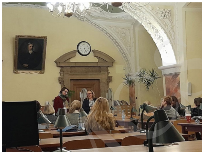
Fot. 11. Prezentacja jednego z wystąpień.