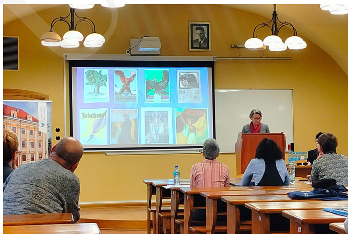
Fot. 2. Prezentacja jednego z wystąpień.