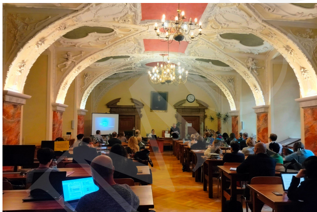
Fot. 8. Prezentacja jednego z wystąpień.

Wystąpienie to zamykało pierwszy dzień konferencji.