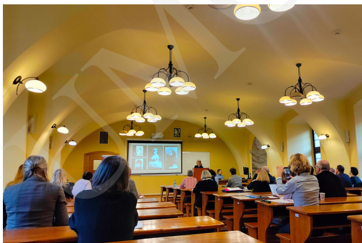
Fot. 3. Prezentacja jednego z wystąpień.

zostaje na jej terenie wiele materiałów wyborczych. Prelegent wskazał, że w bieżącym roku zebrano 3 miliony kilogramów samych banerów, wykonanych z plansz PVC. Liczba ta zapełniła ponad 300 śmieciarek. Stanowi to realne zagrożenie dla środowiska. Powstaje więc pytanie, co zrobić z taką ilością odpadów. Mniejszym problemem są materiały wyborcze papierowe, które można poddać recyklingowi. Plansze PVC zawierające chlor mogą zostać powtórnie wykorzystane np. do docieplania budynków, ponieważ dobrze izolują i chronią przed deszczem. Sprawdzają się również jako zabezpieczenie przedmiotów przechowywanych na zewnątrz. Ostatnio są również wykorzystywane do tworzenia ekozdób lub przedmiotów artystycznych. Wystąpienie to zamknęło pierwszą sesję.