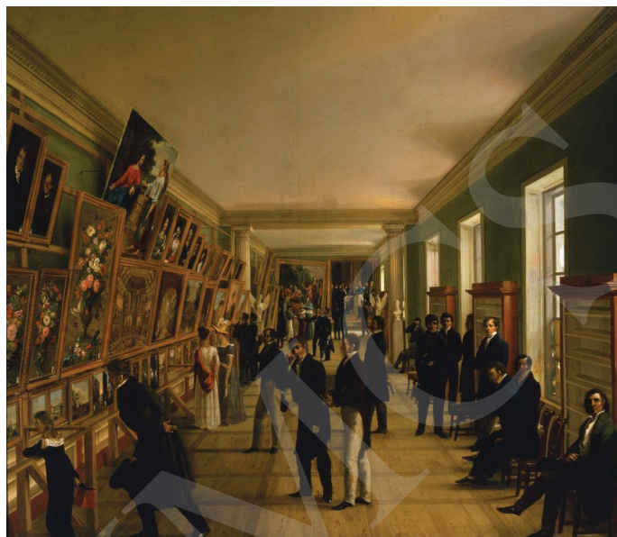
Ryc. 1. Format kieszonkowy – Wincenty Kasprzycki, Widok Wystawy Sztuk Pięknych w Warszawie 1828, 1828 r. , olej na płótnie 94,5 x 111 cm. Muzeum Narodowe w Warszawie.

W większości katalogi są oprawiane w tekturę, często ozdobną, tzw. marmurkową, albo w papier szary i jest to oprawa późniejsza, biblioteczna. Oprawa marmurkowa tekturowa występuje m.in. w Katalogu dzieł sztuk pięknych oraz Katalogu wystawy retrospektywnej nieżyjących malarzy polskich 33 . Były one oprawiane również w oprawy papierowe, czasami barwione na różne kolory. Prezentowane oprawy tekturowe i papierowe miały ograniczone zdobnictwo. Przede wszystkim walory estetyczne oprawy katalogu podnosił kolor tektury lub papieru – barwiono je na brązowo, zielono, niebiesko lub czerwono. Katalogi, jako wydania tzw. proste, obejmujące jedynie tekstową część informacyjną, oprawiano broszurowo 34 .