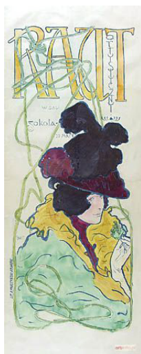
Wojciech Weiss, Raut artystyczny , 1898