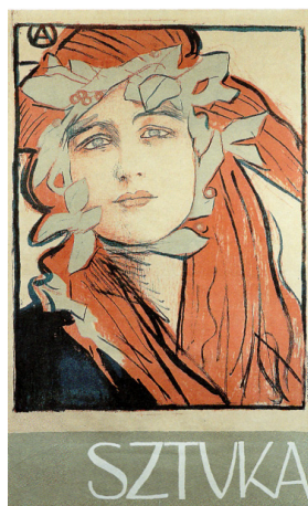
Teodor Axentowicz, Sztuka , 1898