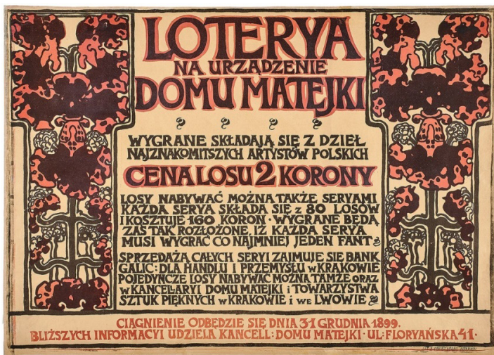
Józef Mehoffer, Loterya na urządzenie Domu Matejki , 1899

Prace Wygrzywalskiego, Axentowicza i Weissa ograniczają przekaz słowny, podporządkowując go ekspresyjnej grafice, a więc w pełni spełniają kryterium plakatu. W przypadku dzieła Mehoffera przynależność formalna nie jest już tak oczywista. Tekst, jak w afiszu, jest rozbudowany. Jednak dekoracyjne liternictwo i tekst regularnie rozlokowany na płaszczyźnie kartonu tyleż „znaczy”, co i „wygląda”, informuje migocącymi plamami koloru, współgrającymi z kwietną ramą po obu stronach kompozycji. To nie afisz, ale też i nie plakat. To „afiszoplakat” (Łajka, 2013), twór łączący cechy obu tych form przekazu.