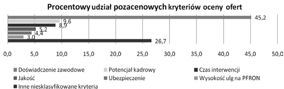
Rys. 4. Stosowanie pozacenowych kryteriów oceny ofert w zamówieniach na usługi ochrony w pierwszym kwartale 2015 r.