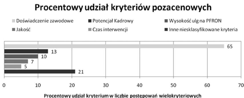
Rys. 2. Procentowy udział pozacenowych kryteriów oceny ofert w zamówieniach na usługi ochrony w 2013 r.

Przetargi, w których stosowano kryteria inne niż cena, stanowiły tylko 7% ogółu wszystkich zamówień publicznych na usługi ochrony. Wśród tej grupy najpopularniejsze kryteria zostały zaprezentowane na rys. 2. Odsetki te nie sumują się do 100%, ponieważ niektórzy zamawiający wybrali więcej niż jedno kryterium pozacenowe.