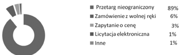
Rys. 3. Zamówienia publiczne według zastosowanego trybu w ujęciu procentowym w pierwszym kwartale 2015 r.