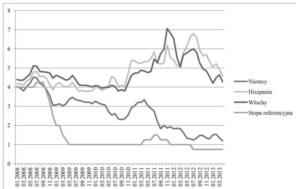
Rysunek 2. Stopy referencyjne EBC i rentowność rządowych papierów dłużnych wybranych państw strefy euro w okresie styczeń 2008–marzec 2013 roku (w %)

gospodarczej w strefie euro, stopy procentowe EBC zwiększono o 25 punktów bazowych. Do następnej takiej podwyżki doszło 13 listopada 2011 roku. 9 listopada 2011 roku rozpoczął się natomiast kolejny okres obniżek stóp procentowych. W wyniku czterech decyzji stopa referencyjna została zredukowana o 100 punktów bazowych, zaś stopa depozytowa osiągnęła poziom 0%. W ten sposób stopy procentowe w strefie euro osiągnęły historyczne minimum.