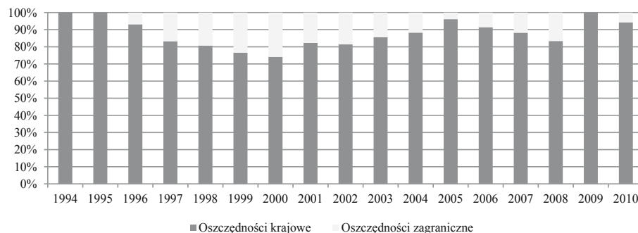
Rysunek 1. Udział procentowy w finansowaniu inwestycji krajowych oszczędności krajowych oraz oszczędności zagranicznych w Polsce w latach 1994–2010

Inwestycje krajowe w Polsce w latach 1994–2010 były w przytłaczającej wielkości finansowane oszczędnościami krajowymi. Stopień pokrycia średniorocznych inwestycji krajowych oszczędnościami krajowymi wynosił w tym okresie średniorocznie około 89%. Zmiany udziału procentowego finansowania inwestycji przez oszczędności krajowe oraz zagraniczne (różnica między inwestycjami krajowymi a oszczędnościami krajowymi) w Polsce w okresie od 1994 do 2010 roku przedstawiono na rysunku 1. Z kolei na rysunku 2 pokazano kształtowanie się inwestycji i oszczędności krajowych w relacji do PKB.