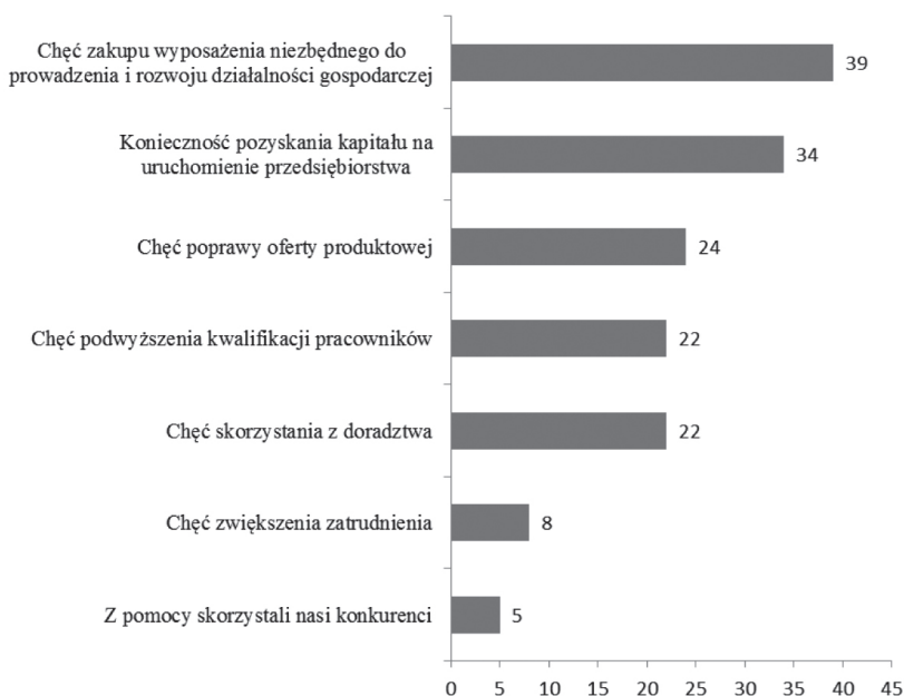
Rysunek 1. Przyczyny współpracy przedsiębiorstw z instytucjami otoczenia biznesu