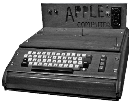
Apple-1 (1976 r.)

W nowoczesnym podejściu do systemu identyfikacji wizualnej pojęcie to rozciąga się na inne, do tej pory pomijane obszary. Na przykład coraz większy nacisk kładzie się na estetykę produktów oraz ich opakowań (por. rysunek 4). Jak twierdzi Moira Cullen, „design odgrywa fundamentalną rolę w kreowaniu marek; projekt wyodrębnia i uosabia rzeczy nieuchwytnie – emocje, kontekst, istotę, które mają największe znaczenie dla konsumentów” [Wheeler, 2010, s. 4].