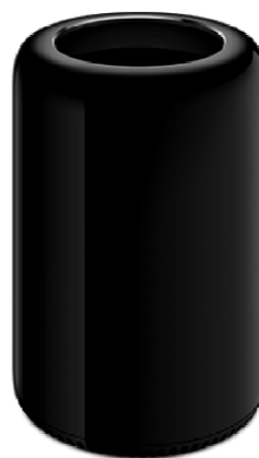
Mac Pro (2014 r.)

Rysunek 4. Jeden z pierwszych komputerów firmy Apple oraz produkt współczesny