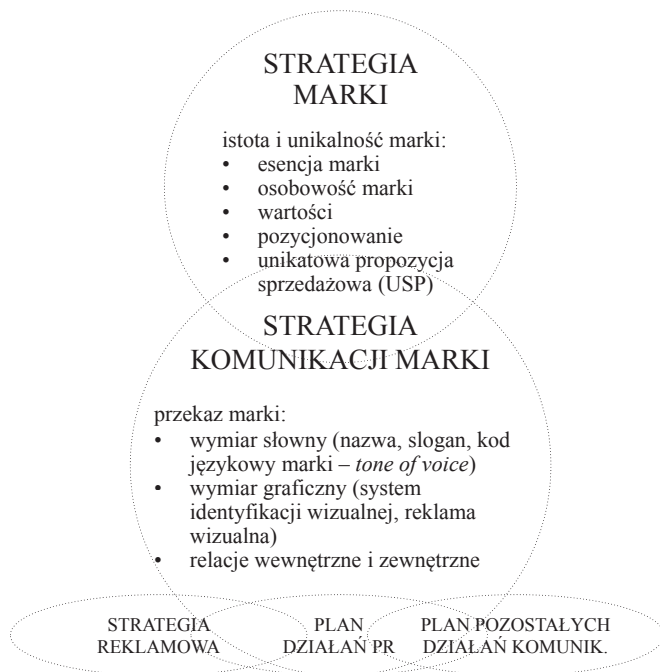
Rysunek 3. Strategia marki a strategia komunikacji marki

Komunikacja na poziomie werbalnym to specyficzny język marki, jej wymiar słowny. Najbardziej oczywistym elementem tego języka jest nazwa marki, która powinna odbiorcom czytelnie prezentować esencję marki. Oprócz wyboru nazwy marki i sloganu należy ustalić tzw. kod językowy marki ( tone of voice ), który jest zbiorem reguł rządzących stylem komunikacji werbalnej. Chodzi na przykład o dobór słownictwa używanego w komunikacji marki, sposób pisania tekstów reklamowych, itp.