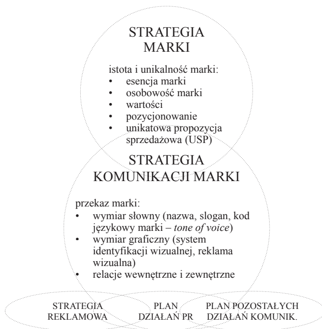
Rysunek 3. Strategia marki a strategia komunikacji marki

Komunikacja na poziomie werbalnym to specyficzny język marki, jej wymiar słowny. Najbardziej oczywistym elementem tego języka jest nazwa marki, która powinna odbiorcom czytelnie prezentować esencję marki. Oprócz wyboru nazwy marki i sloganu należy ustalić tzw. kod językowy marki ( tone of voice ), który jest zbiorem reguł rządzących stylem komunikacji werbalnej. Chodzi na przykład o dobór słownictwa używanego w komunikacji marki, sposób pisania tekstów reklamowych, itp.