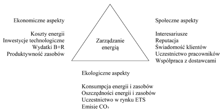
Rys. 1. Aspekty efektywności energetycznej w kontekście rozwoju zrównoważonego