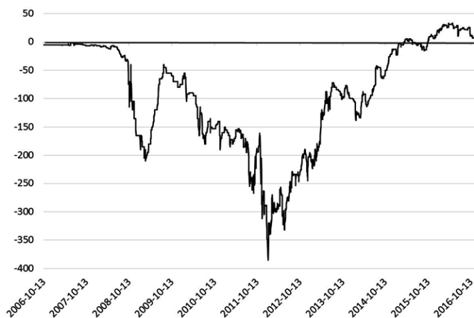
Rys. 2. Spread bazowy dla pary EUR/HUF (CCBS 5Y)

Operacje przewalutowania miały jednak wpływ na rynek swapów walutowych. Zmienność cen dla swapa bazowego EUR/HUF została przedstawiona na rys. 2.