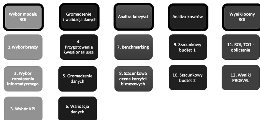
Rys. 3. Szczegółowy proces oceny PROEVAL