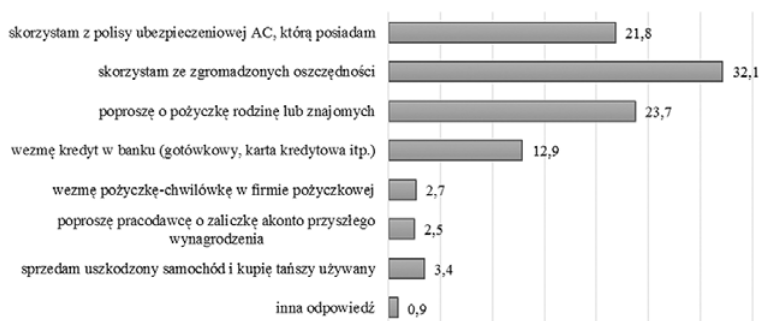
Rys. 2. Źródła finansowania nieprzewidzianych wydatków przez Polaków