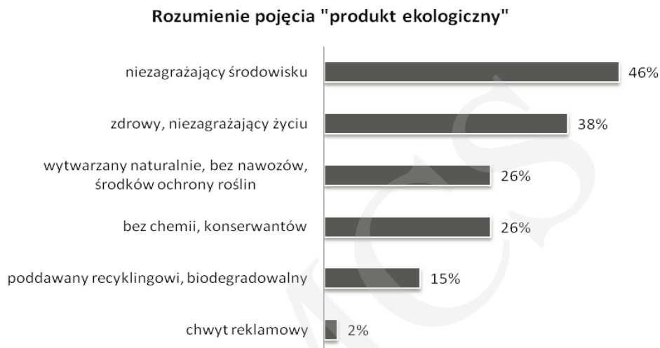
Rysunek 1. Rozumienie pojęcia „produkt ekologiczny” w opinii badanych konsumentów