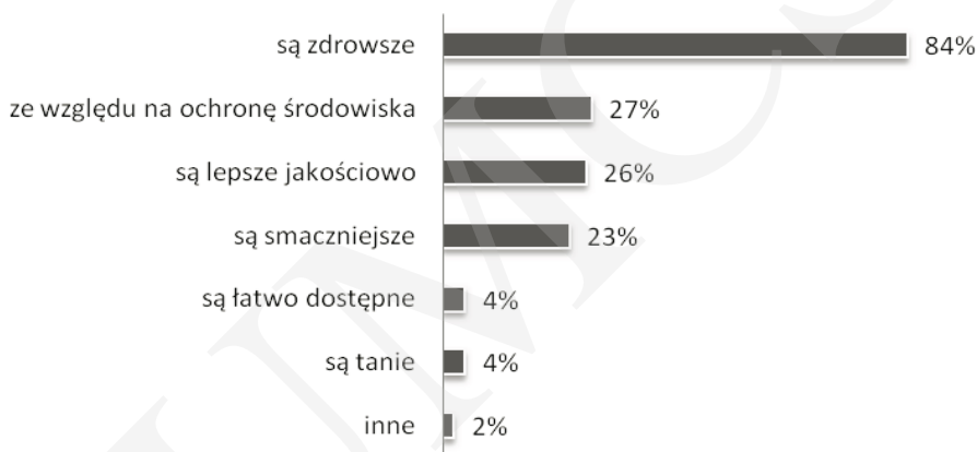
Rysunek 3. Motywy kupowania produktów ekologicznych