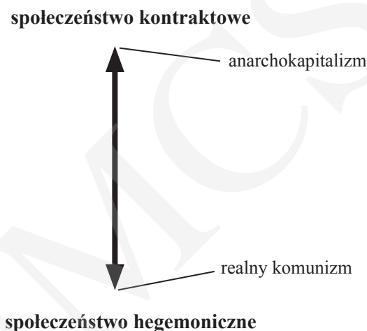
Wykres 2. Podział społeczeństw na podstawie typologii Rothbarda a ideologie

istnienia (od końca XVII do początku XX w.). Te przykłady można uzupełnić również innymi. W celu uniknięcia nieporozumień przy tworzeniu takiego rankingu, w odniesieniu do typów bardziej empirycznych niż te zaproponowane przez Rothbarda, niezbędne jest wyodrębnienie precyzyjniejszych kryteriów, które mogłyby posłużyć do systematyzowania społeczeństw według tej skali.