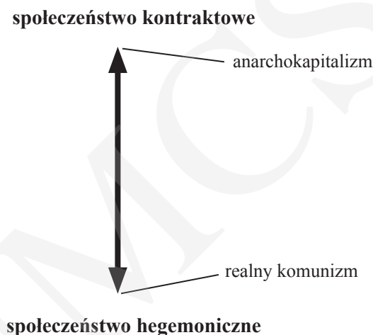
Wykres 2. Podział społeczeństw na podstawie typologii Rothbarda a ideologie

istnienia (od końca XVII do początku XX w.). Te przykłady można uzupełnić również innymi. W celu uniknięcia nieporozumień przy tworzeniu takiego rankingu, w odniesieniu do typów bardziej empirycznych niż te zaproponowane przez Rothbarda, niezbędne jest wyodrębnienie precyzyjniejszych kryteriów, które mogłyby posłużyć do systematyzowania społeczeństw według tej skali.