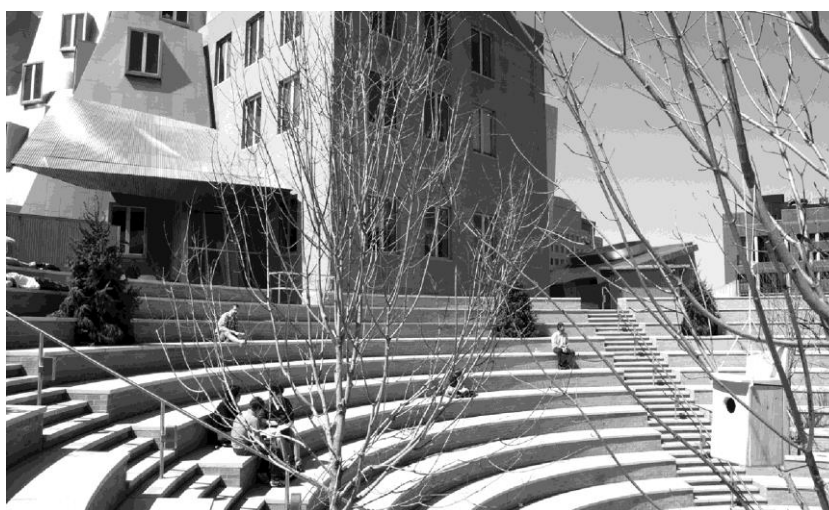
Rys. 4. Przestrzeń integracyjna na przykładzie projektu Fritza Haega w ramach cyklu Animal Estates (ANIMAL ESTATE regional model homes 3.0). Program dla miasta Cambridge, Massachusetts. Komisarz wystawy – Center for Advanced Visual Studies at MIT, kwiecień 2008.[7] autor: Frith Haeg.

zmiany sposobu użytkowania przestrzennego, w których powstają przestrzenie o mieszanym przeznaczeniu (są więc bardziej konfliktogenne z racji różnych praw własności) lub miejsca łączenia funkcji o charakterze liniowym i plamowym, jak parki z ciągami zieleni rekreacyjnej. Bardzo często zagospodarowuje się w ten sposób nieużytki miejskie, czyli miejsca posiadające prawnego właściciela, lecz celowo pozostawione w stanie niezagospodarowanym, a wykorzystywane biernie, np. pasy zieleni izolacyjnej, ochronnej itp.