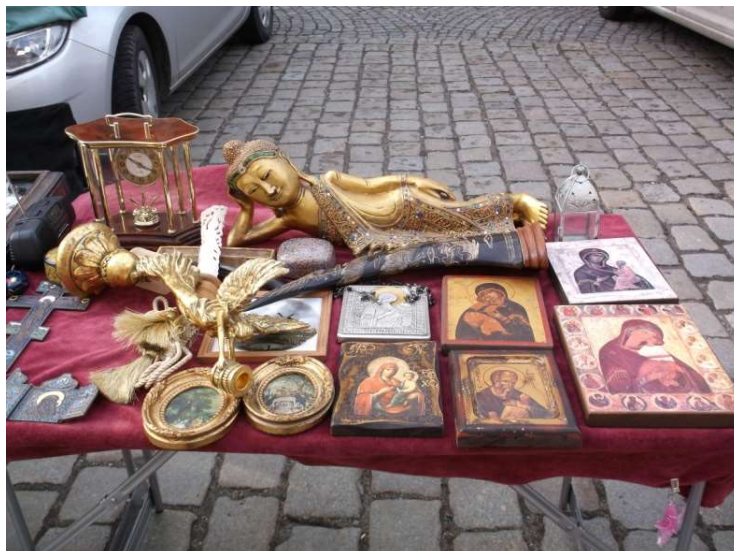
Fot. 6. Budda z Madonnami

Przedmioty te nie straciły związków z miejscami swego powstania, bo gdyby nie te miejsca, nie byłoby częścią świdnickiego Rynku. Na Madonnach widać farby z tamtych miejsc, a czasem i specyficzny sposób ich nakładania. Znaczki mają na sobie tusz pobrany stemplem z leżącej obok niego poduszki i nadal odcisnięty jego specyficzny kształt. Ogrom przedmiotów i ich powiązań z innymi miejscami wiąże Rynek z ogromem innych miejsc na Ziemi na wszystkim zamieszkałych przez człowieka kontynentach, czyniąc w swoisty sposób Rynek światem, a świat Rynkiem.