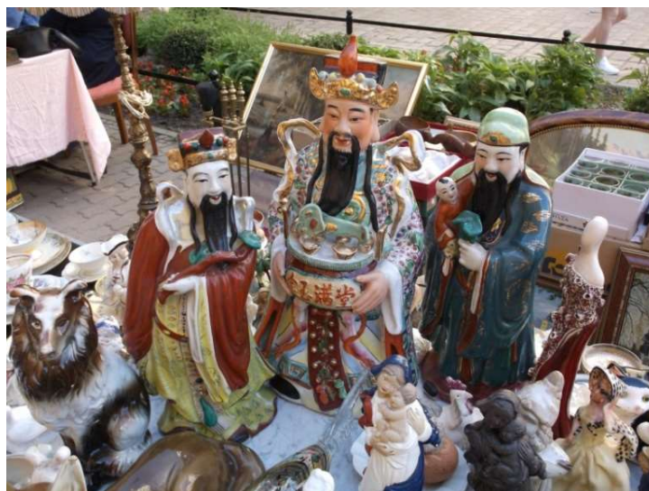
Fot. 5. Przybysze ze Wschodu

znaczki wraz z wieloma innymi przedmiotami na świdnickim Rynku w specyficzny sposób wychodzą naprzeciw postulatam autorek. Przybyły tu z różnych miejsc. Mniej lub bardziej odległych. Kiedyś były ich integralną częścią, a teraz są elementem świdnickiego spotkania, nie tracąc związków z miejscami pochodzenia i poprzedniego pobytu. I nadal są fragmentami tych miejsc. Stanowią więc między lokalnością Rynku i wieloma innymi lokalnościami różnych regionów świata. Znaczki nie są tu wyjątkiem. Czynią to z ogromem innych przedmiotów obecnych tu w tą niedzielę. Na przykład na innym stoisku wśród ceramicznych figurek, z których dzięki sygnaturom można odczytać miejsca produkcji i pochodzenia stoją i rozglądają się trzy orientalne postacie. Nie odnalazłem przy nich żadnych oznaczeń produkcji, lecz przypuszczam, że są przybyszami z dalekiego wschodu świdnickiego Rynku.