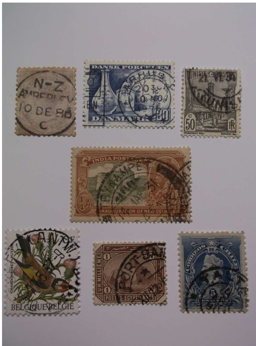
Fot. 4. Znaczki

plowania. W jakiej kolejności? Od najstarszego do najnowszego, a może od najmniejszego do największego? Od tego, który przebył najdłuższą drogę? Niech będzie kolejność z fotografii. To małe skrawki papieru. Największy w środku ma rozmiar 2,5 x 4 cm. Ten poniżej to 2 x 2,5 cm.