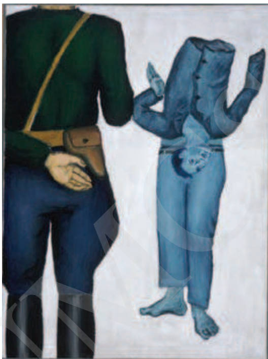
Ilustracja 5. Andrzej Wróblewski, Rozstrzelanie z esesmanem , reprodukcja [za:] B. Banaś, Andrzej Wróblewski , Warszawa 2006, s. 34.

Kolejne pozycje cyklu – Rozstrzelanie surrealistyczne , Rozstrzelanie na ścianie , Rozstrzelanie z chłopczykiem czy Rozstrzelanie rodziny – ujmują motyw śmierci w podobnej stylistyce. Obrazy działają na odbiorcę bardzo silnie. Choć nigdzie nie widzi się kropli krwi i dramatycznej grozy, płótna przyciągają wzrok. Są nad wyraz czytelne w swojej wymowie, jednocześnie zmuszają do przemyśleń. Wróblewski wykorzystywał obraną przez siebie symbolikę barw, postacie ukazywał anonimowo, w wizji statycznej, i m.in. przez to, jak mówił Witold Damasiewicz, unaoczniał „powolne odbieranie człowiekowi człowieczeństwa i nakazywanie mu stawania się rzeczą” 31 .