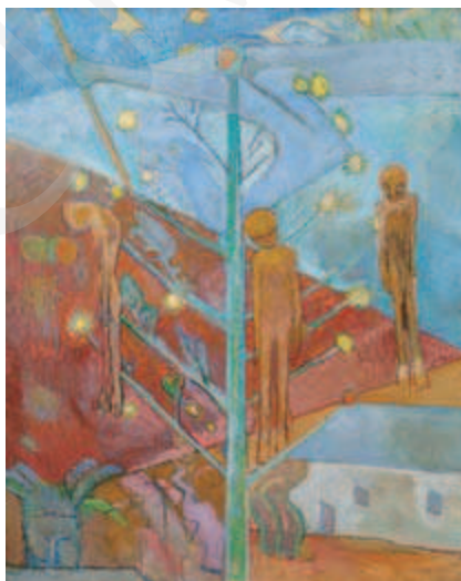
Ilustracja 8. Xawery Dunikowski, Boże Narodzenie w Oświęcimiu 1944 , 1950, Muzeum Narodowe, Kraków.

Dramat pobytu w obozie oświęcimskim uwidocznili w swoich pracach również Xawery Dunikowski (1875-1964) 39 . Rysunki wykonywane przez artystę w obozowej stolarni, a także dzieła wielkoformatowe powstałe już po wojnie, oddają jego przeżycia. Symboliczna wizja obozowych doświadczeń widoczna jest na wielu jego płótnach, takich jak Orkiestra , Ruszty czy Droga do wolności oraz – szczególnie znany – Boże Narodzenie w Oświęcimiu w 1944 roku . Obraz ten – o kolorystyce pastelowej, choć w barwach zimnych – przedstawia choinkę, a na niej wiszące zwłoki zamiast ozdób. W tej brutalnej deformacji tematyki świątecznej dojmująco odzywają się zmagania z obozową gehenną: