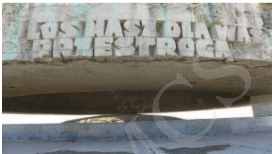
Ilustracja 6. Pomnik Walki i Męczeństwa Narodu Polskiego i Innych Narodów – Droga Hołdu i Pamięci – Mauzoleum (fragment), były niemiecki obóz koncentracyjny na Majdanku w Lublinie, fot. R. Gozdecka (2015).

Ku czci ofiar hitlerowskich obozów zagłady wzniesiono w 1984 roku pomnik-mauzoleum na Powązkach Wojskowych w Warszawie, według projektu Stanisława Soszyńskiego. Zostały w nim umieszczone urny z prochami pomordowanych w czternastu różnych obozach koncentracyjnych. Konstrukcja budowli ma kształt ramp kolejowych, pomiędzy którymi umieszczono ślady butów, rampy zaś prowadzą do krzyża i tablicy o kształcie pieca krematoryjnego. Na tablicy widnieje napis: „Prochy Polaków pomordowanych w hitlerowskich obozach koncentracyjnych wołają o pokój świata”.