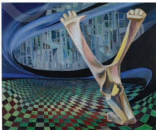
Ilustracja 1. Marian Bogusz, Symfonia liturgiczna Honeggera , 1955, olej, płyta pilśniowa, 100 x 120 cm, Galeria Sztuki Nowoczesnej Muzeum Okręgowego im. Leona Wyczółkowskiego w Bydgoszczy.

Symfonia „Liturgiczna” stała się natchnieniem dla polskiego malarza okresu powojennego Mariana Bogusza (1920-1980), który jedną ze swoich prac opatrzył tytułem tej właśnie kompozycji. Podczas okupacji Bogusz przebywał w niemieckim obozie w Mauthausen i niewątpliwie sytuacja ta miała wpływ na kształt jego dzieła: