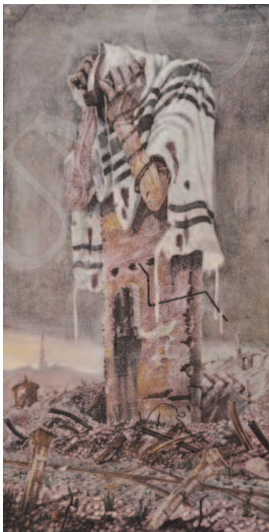
Ilustracja 4. Bronisław Wojciech Linke, El mole rachmim , 1946, z cyklu Kamienie krzyczą .

dookoła ręki, zrozpaczony, modlący się Żyd, jest owym „krzyczącym kamieniem” – fragmentem zrujnowanego domu, w pogorzelisku pogiętych tramwajowych szyn, w ruinach getta. Szczątki kamienicy przyjęły ludzkie kształty. Spersonifikowana budowla to wizerunek nie tylko zrujnowanej stolicy; w obliczu wielkich strat jest także sygnałem, że nie wszystko zostało utracone. Pozostał człowiek. Obraz Linkego, reprodukowany w licznych publikacjach poświęconych holocaustowi, można odczytać wielorako: jako hołd dla poległych, upamiętnienie ludzkich tragedii, głos lamentu, wreszcie bogaty w treści, metaforyczny komentarz autorski.