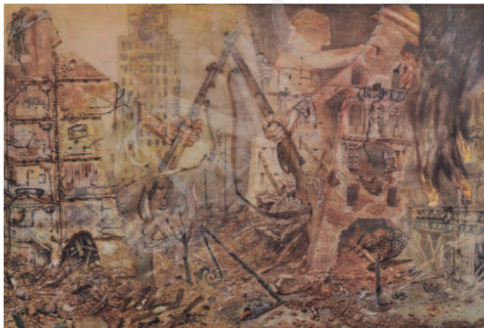
Ilustracja 3. Bronisław Wojciech Linke, Domy-żołnierze , 1947, z cyklu Kamienie krzyczą .

prace z cyklu Kamienie krzyczą 25 wystawiło Muzeum Narodowe w Warszawie już w 1948 roku, w tym m.in. obraz Domy-żołnierze – gdzie „domy rozdarte bombami otworzyły swoje wnętrza, ekshibicjonistycznie ukazując nie tylko dramat, ukazały rzeczy dotąd ukryte” 26 . Kompletny cykl powstający przez dziesięć lat (1946-1956) tworzy czternaście obrazów, spośród których w szczególny sposób uderzają swoją wymową Getto niezłomne , Egzekucja na ruinach Getta , El mole rachmim , Domy-żołnierze oraz Misterium 27 . Porażająca wizja ruin stolicy ukazana została przez Linkego w specyficznych kształtach kamienic uformowanych na kształt ludzkich postaci, o wręcz monstrualnych rozmiarach, pozbawionych realizmu.