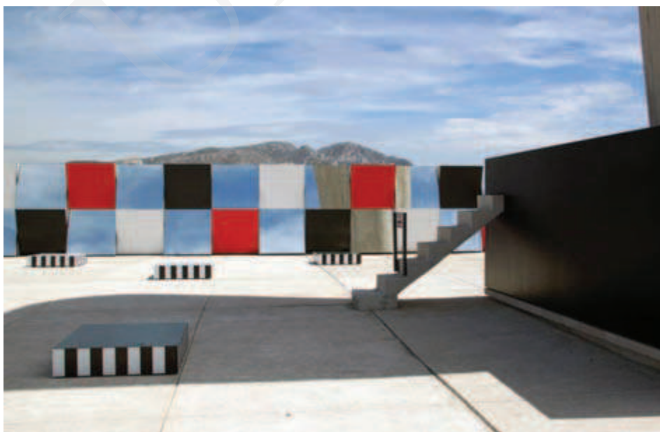
Ilustracja 9. Daniel Buren, instalacja Défini, Fini, Infini na dachu Jednostki Marsylskiej (2014).