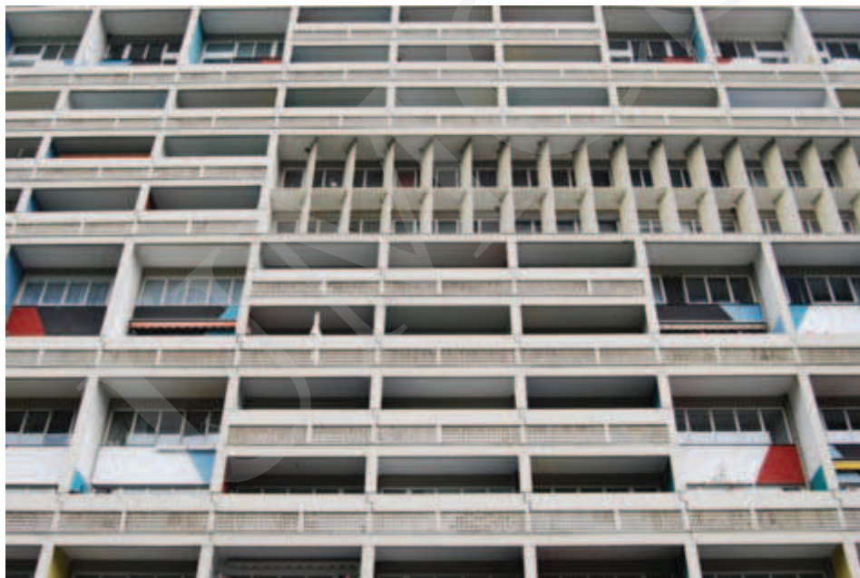
Ilustracja 11. Relief elewacji Jednostki Berlińskiej.

Jednostka Berlińska posiada podobny, jakkolwiek znacznie zubożony schemat funkcjonalny; także i tu Le Corbusier zaprojektował pasaż handlowy dla mieszkańców. Do dzisiaj w budynku jednostki funkcjonują poczta i dostępny dla turystów hotel. Budynek ten, podobnie jak wszystkie inne realizacje szwajcarskiego architekta, przyciąga rzesze zwiedzających. Rozrzeźbiona elewacja i łamacze słońca ( brise soleil ) zastosowane w Berlinie przypominają wprawdzie realizację z południa Francji, równocześnie jednak przyjęte rozwiązania wydają się nieadekwatne do poziomu i natężenia insolacji w tym rejonie Europy (il. 11, 12).