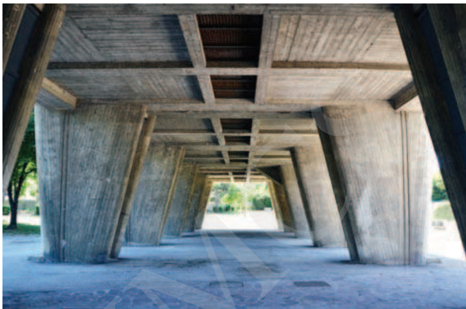
Ilustracja 5. Pilotis , Marsylia (2012).

Swobodny przepływ przestrzeni miał dotyczyć całego budynku, w tym także dachu jednostki, który zyskał nową funkcję – stał się miejscem spotkań mieszkańców. W jego program wpisano funkcję przedszkola i sali sportowej. Wzniesiono także miejsca do siedzenia w postaci solarium, mały basen i bieżnię obiegającą budynek.