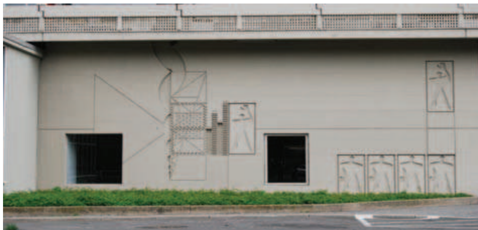
Ilustracja 12. Modułor na elewacji Jednostki Berlińskiej, fot. A. Pilip (2010).