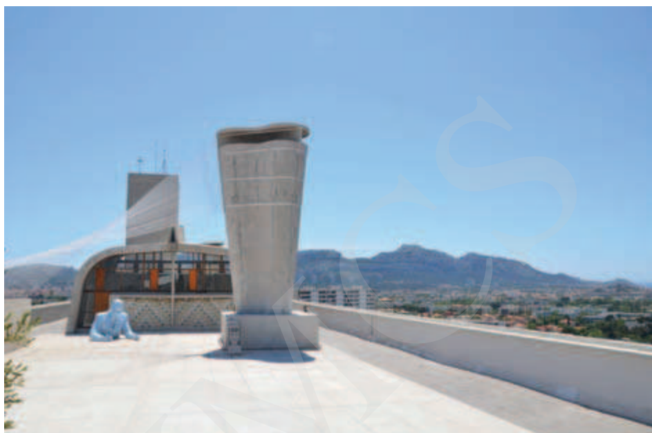
Ilustracja 8. Xavier Veilhan, instalacja Architectones na dachu Jednostki Marsylskiej.