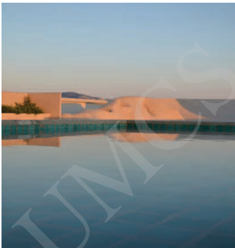
Ilustracja 6. Sztuczne góry Le Corbusiera na dachu Jednostki Marsylskiej.