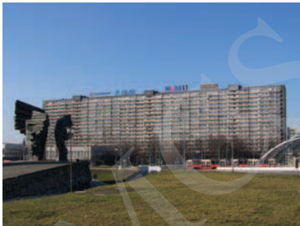
Ilustracja 13. Superjednostka w Katowicach 24 .

cają się widokami z okien na Beskidy, a przy dobrej przejrzystości powietrza – nawet na Tatry 23 .