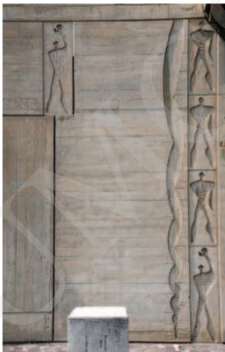
Ilustracja 4. Le Modulor na elewacji Unite d'Habitation , Marsylia, fot. K. L. Boguszewska (2014).

Budynek o wysokości 56 metrów, głębokości 24 i 137 metrów długości mieścił 337 mieszkań przeznaczonych dla 1600 osób. Jego schemat funkcjonalny oparty został na systemie dwukondygnacyjnych mieszkań o przekroju litery L 5 . Ich wysokość, a także inne parametry określone zostały przez system metryczny Modulor opracowany przez Le Corbusiera (zob. il. 4).