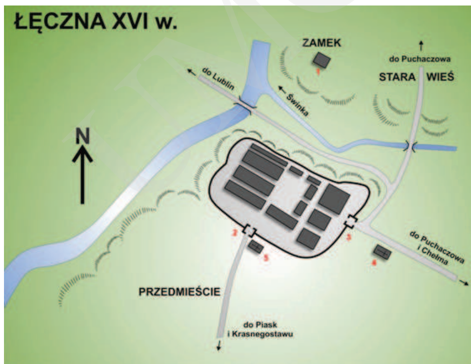
Ilustracja 1. Rekonstrukcja układu przestrzennego miasta Łęczna w XVI wieku. 1 – Zamek; 2 – Brama Krasnostawska; 3 – Brama Chełmska; 4 – Kościół parafialny; 5 – Kościół szpitalny Św. Ducha, oprac. M. Dudkiewicz, wg Maciuka, [w:] Łęczna. Studia z dziejów miasta , red. E. Horoch, Łęczna 1989, s. 38.

Pierwsza wzmianka o Łęcznej – z pisownią Laczna – pochodzi z 1252 roku. Była to wówczas własność opactwa sieciechowskiego, a później, w roku 1428, Stefana z Łęcznej. Ziemie łączyńskie leżały na granicy wpływów Małopolan, pomiędzy województwem chełmskim i Księstwem Halicko-Wołyńskim, co prawdopodobnie było przyczyną wzniesienia na skraju wysokiego ujścia Świnki do Wieprza zamku obronnego 1 (zob. il. 1). 7 stycznia 1467 roku Kazimierz Jagiellończyk nadał Łęcznej prawa miejskie. Miasto osadzono na 36 łanach na skrzyżowaniu dwóch szlaków handlowych: z Wołunia do Lublina, i z Podkarpacia na Podlasie 2 .