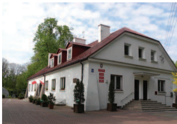
Ilustracja 4. Budynek dworu – elewacja północna, fot. M. Dudkiewicz (2012).