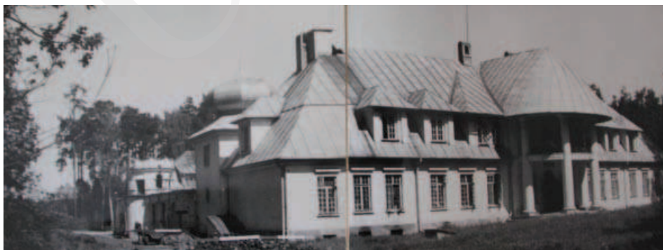
Ilustracja 6. Widok na główną elewację zewnętrzną pałacu w Adampolu.

Na wniosek Wojewódzkiego Wydziału Zdrowia w 1946 roku pałac w Adampolu wraz z przylegającymi gruntami przekazano dla potrzeb sanatorium przeciwgruźliczego, co wiązało się z przebudową i dostosowaniem budynków zespołu 33 . Obecnie park pałacowy, położony w lasach dębowo-sosnowych, liczy około 1,5 ha 34 .