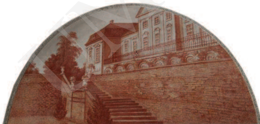
Ilustracja 5. Taras przypałacowy – malowidło z pałacu w Adampolu.