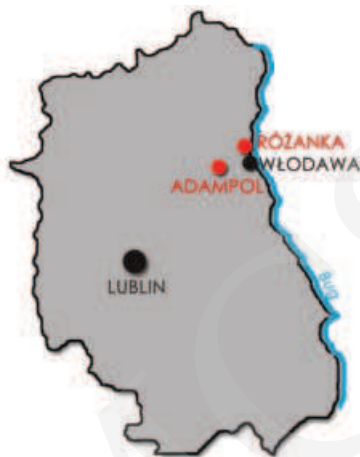
Ilustracja 1. Lokalizacja zespołu pałacowego w Różance i Adampolu na tle aktualnych granic Województwa Lubelskiego, 2014 (oprac. M. Boguszewska)