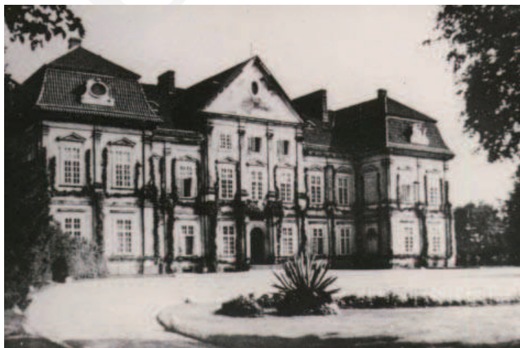
Ilustracja 3. Różanka, zachodnia elewacja pałacu. Stan z początku XX wieku.