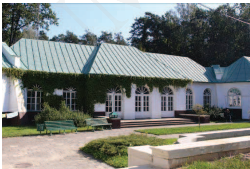
Ilustracja 13. Budynek oranżerii – zespół pałacowy w Adampolu.