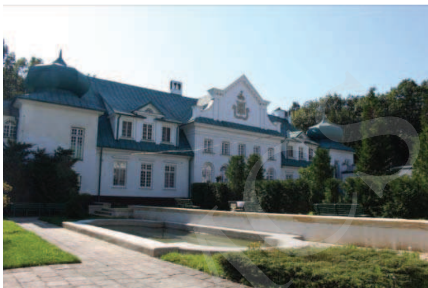
Ilustracja 12. Pałac w Adampolu.