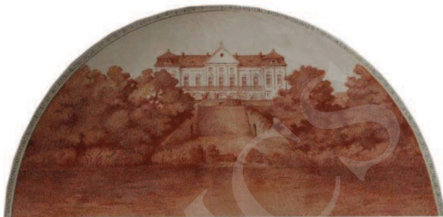
Ilustracja 4. Widok na pałac od doliny Bugu – malowidło w pałacu w Adampolu.