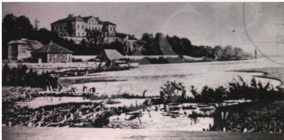
Ilustracja 2. Reprodukacja malowidła ściennego w pałacu w Adampolu. Stan pałacu w Różance po I wojnie światowej. (Fot. w zbiorach p. Paprockiej, [za:] A. Obrębka, op. cit. )

W roku 1972 wydano dokument o przekazaniu prawie 9 ha obejmujących park w Różance na Muzeum Wsi Lubelskiej, jednak decyzja ta nigdy nie weszła w życie, a tereny pozostały do dyspozycji Urzędu Gminy. Przez pewien okres urządzano na terenie parku obozy harcerskie i kolonie, a w latach 70. XX wieku na południowym obrzeżu założenia rozpoczęto budowę Domu Spokojnej Starości oraz budynków mieszkalnych 23 .