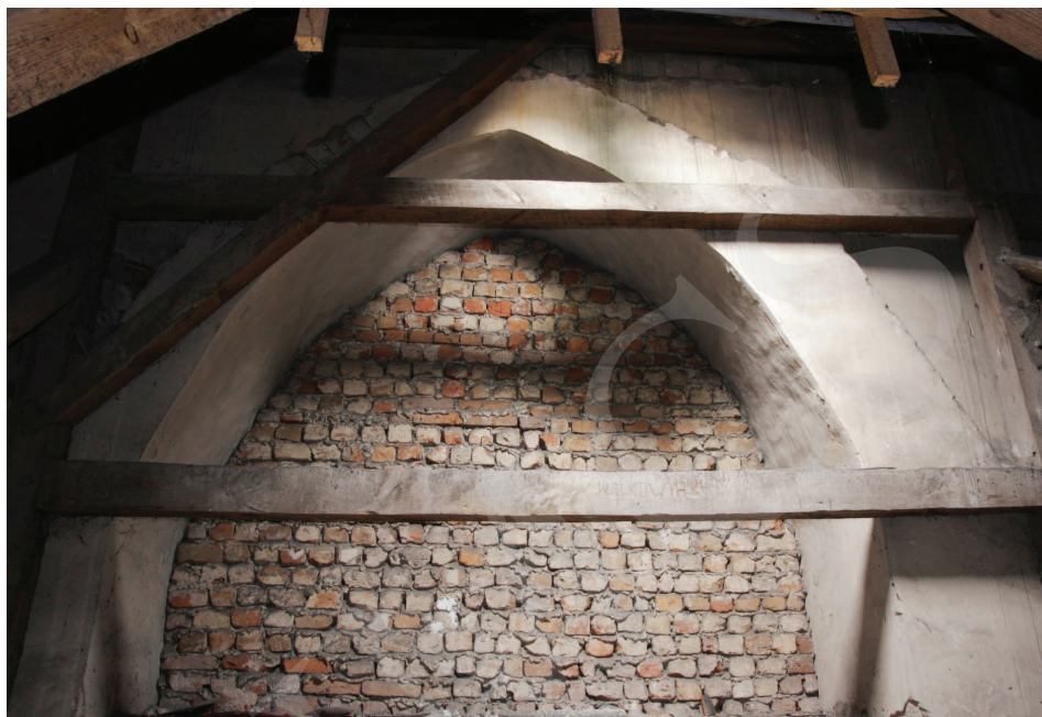
Ilustracja 6. Kościół farny we Wrześni – widok z poddasza nawy południowej na gotycką arkadę międzynawową, fot. M. Potocki (2009)