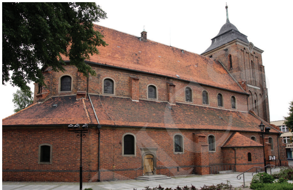
Ilustracja 1. Kościół farny we Wrześni – widok od strony północnej, fot. M. Potocki (2009)