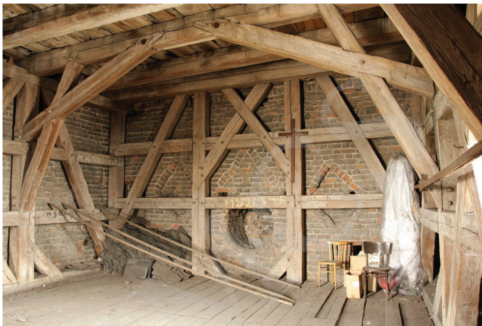
Ilustracja 4. Kościół farny we Wrześni – pozostałości dekoracji fasady korpusu pierwszej fazy. Widok z wnętrza wieży, fot. M. Potocki (2009)