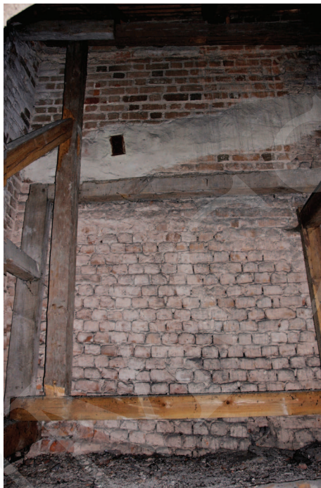
Ilustracja 8. Kościół farny we Wrześni – widok z poddasza obecnej zakrystii na zamurowane przezrocze empory, fot. M. Potocki (2009)