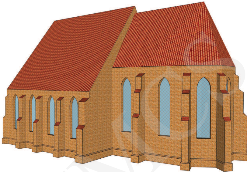
Ilustracja 10. Rekonstrukcja bryły kościoła farnego we Wrześni przed dobudowaniem wieży. Widok od południowego wschodu, oprac. W. Miedziak