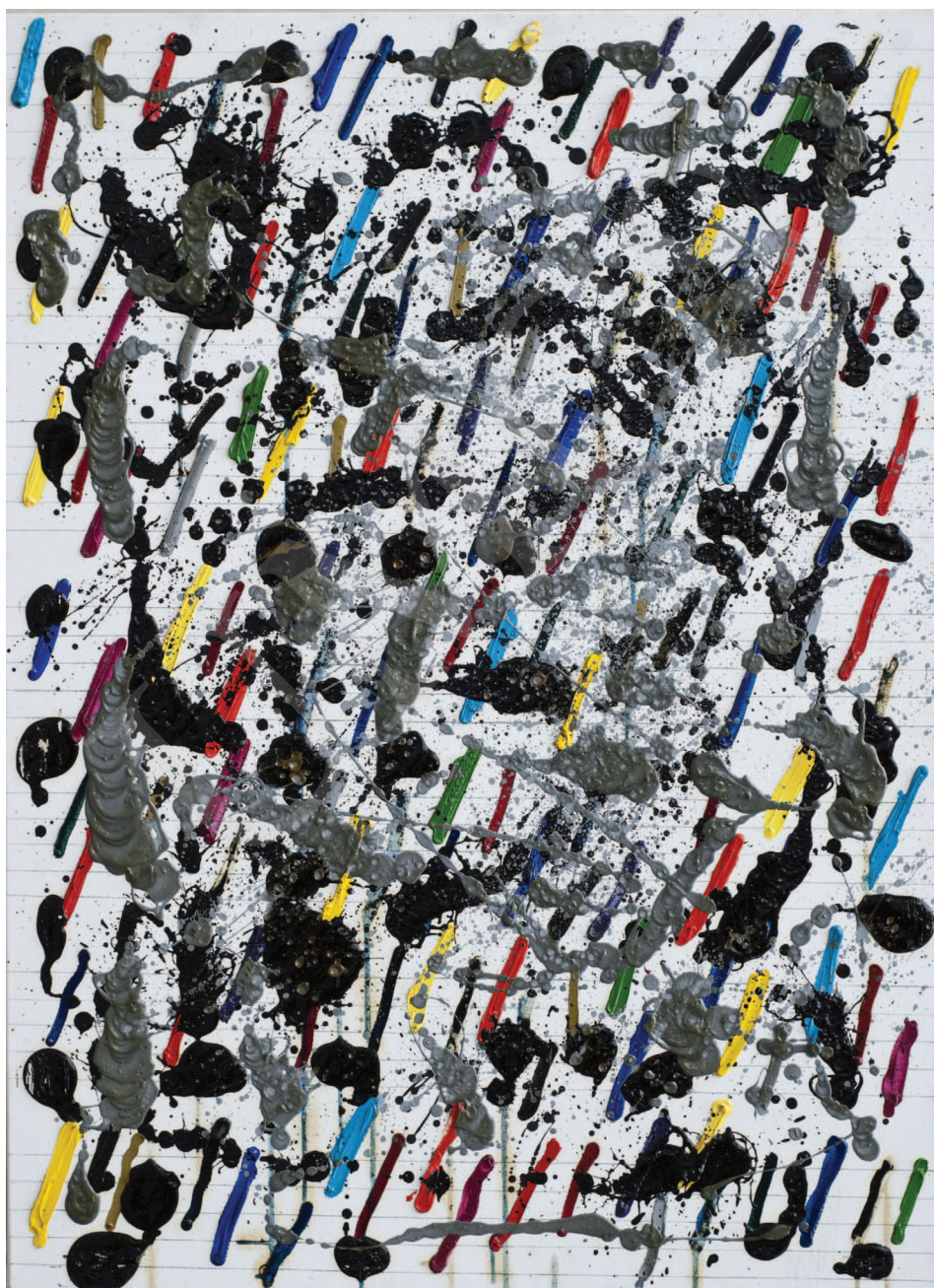
Ilustracja 1. W. Pawlak, Partytura do baletu Sokrates III , 2003, 73x100 cm, fot. K. Kuzko