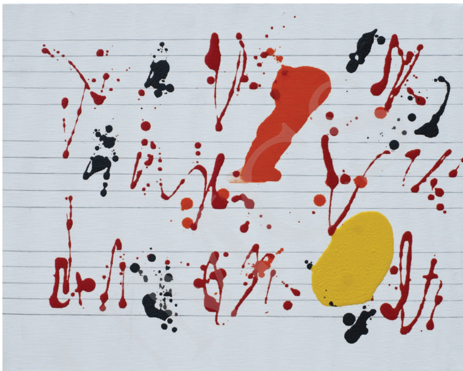
Ilustracja 3. W. Pawlak, Partytura do baletu Sokrates XXXXXXXXXVIII , 2008, 40x50 cm