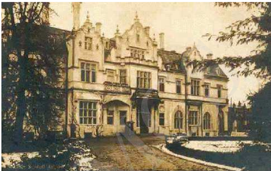
Il. 1. Pałac w Jabloniu, najstarszy znany widok z austriackiej widokówki z 1915 roku.