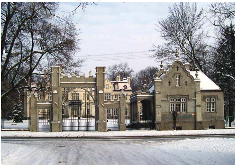
Il. 2. Pałac w Jabloniu, brama wjazdowa i kordegarda, w głębi pałac. Fot. A. Cebulak, luty 2005.