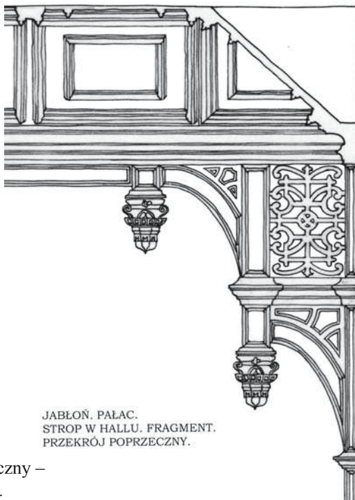
JABŁOŃ. PAŁAC. STROP W HALLU. FRAGMENT. PRZEKRÓJ POPRZECZNY.