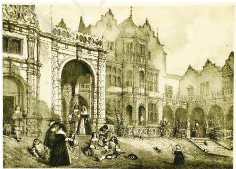
Il. 6. Holland House (Kensington).