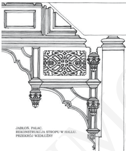
JABŁOŃ. PAŁAC. REKONSTRUKCJA STROPU W HALLU. PRZEKRÓJ WZDŁUŻNY