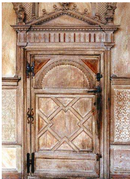
Il. 10. Haddon Hall , drzwi w Long Galery.