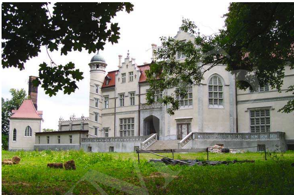
Il. 5. Pałac w Jabłoniu, elewacja ogrodowa. Fot. A. Cebulak, lipiec 2006.