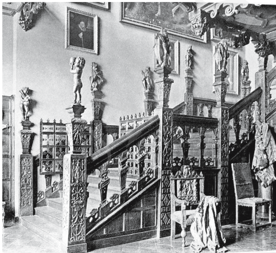
Il. 13. Hatfieldd Hause , klatka schodowa.