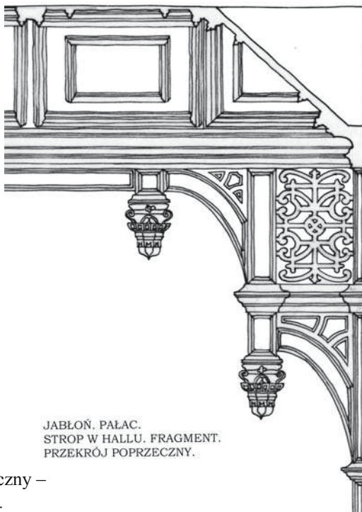
JABŁOŃ. PAŁAC. STROP W HALLU. FRAGMENT. PRZEKRÓJ POPRZECZNY.