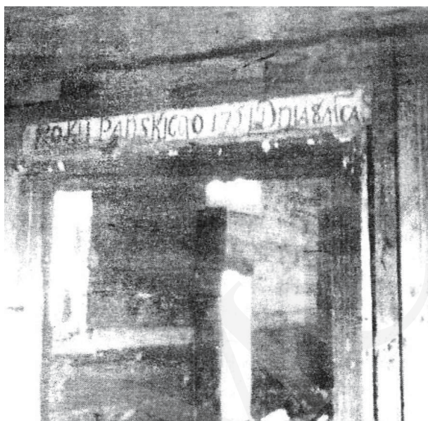
Il. 4. Michale – inskrypcja na nadprożu. Repr. z: O. Хведів, На кручі Бугу (Свято-Введнська церква села Михале). Історико-краєзнавчий нарис , Луцьк 2002, s. 11.