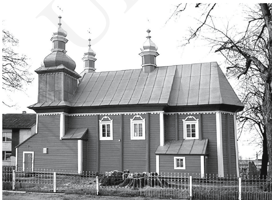
Il. 5. Olble Ruskie na Wołniu (obecnie: Грудки) – unicka cerkiew dwuwieżowa z 1771 roku.