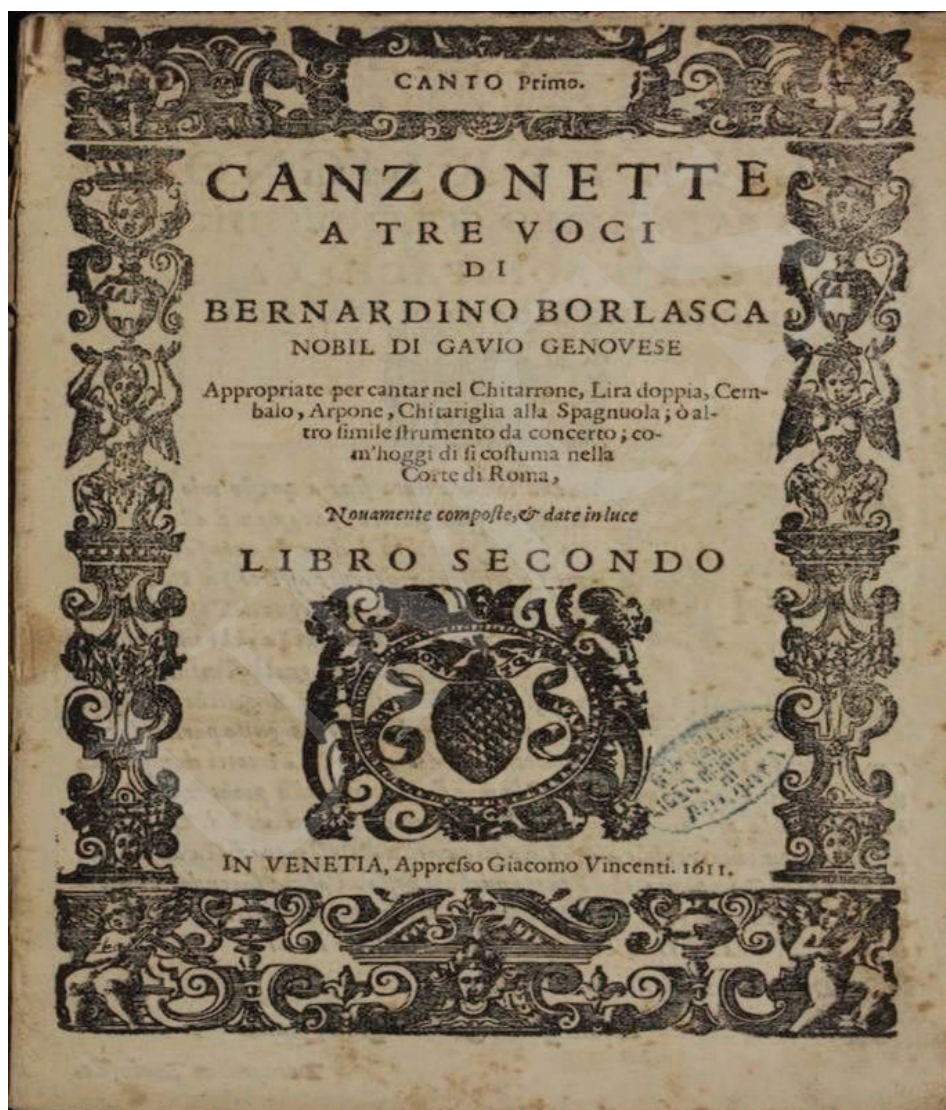
Ilustracja 4. Bernardino Borlasca, Canzonette , I-Bc, sygn. X. 140.