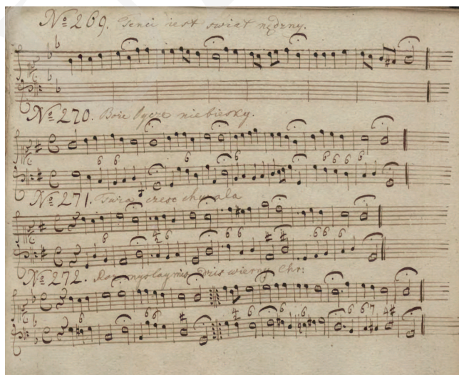
Ilustracja 1. Karta z rękopisu Muz. V 94, pieśni nr 269-272; cyt. [za:] Elbląska Biblioteka Cyfrowa, adres internetowy: oai.libra.bibliotekaelblaska.pl:18732 [data dostępu: 10.10.2014].

Wszystkie pieśni łączy to, że nie mają podpisanych tekstów słownych i oznaczone są jedynie ich incypitami, stanowiącymi tytuły poszczególnych pozycji. Jest to kolejna odsłona niepełności przekazu, bo jeśli nawet owe incypity prowadzą do zidentyfikowania tekstów, to w niektórych wypadkach pojawiają się wątpliwości co do ich konkretnych wariantów, a sporadycznie nawet, co do samej tożsamości tekstu wskazanego przez incypit. Równocześnie jednak brak tekstów nie jest na tyle dotkliwy, aby nie można było wiarygodnie i z dużą dozą prawdopodobieństwa odtworzyć warstwy słownej większości utworów.