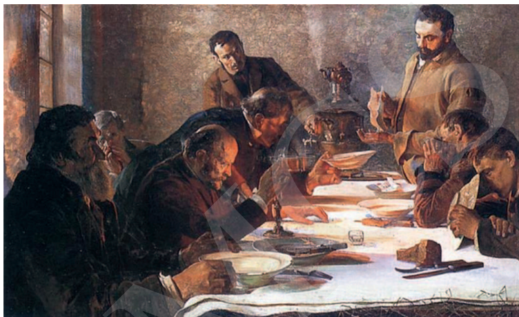
Ilustracja 1. J. Malczewski, Wigilia na Syberii , 1892, wymiary: 81cm x 126cm.

Ten narodowy, fundamentalny dla sztuki Malczewskiego aspekt widzimy również w cyklu obrazów związanych z Syberią – Na etapie. Sybiracy (1890), Sybiracy (1891) i Wigilia na Syberii (1892) 15 . Ostatni z nich zainspiruje Kaczmarskiego.