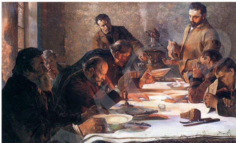
Ilustracja 1. J. Malczewski, Wigilia na Syberii , 1892, wymiary: 81cm x 126cm.

Ten narodowy, fundamentalny dla sztuki Malczewskiego aspekt widzimy również w cyklu obrazów związanych z Syberią – Na etapie. Sybiracy (1890), Sybiracy (1891) i Wigilia na Syberii (1892) 15 . Ostatni z nich zainspiruje Kaczmarskiego.