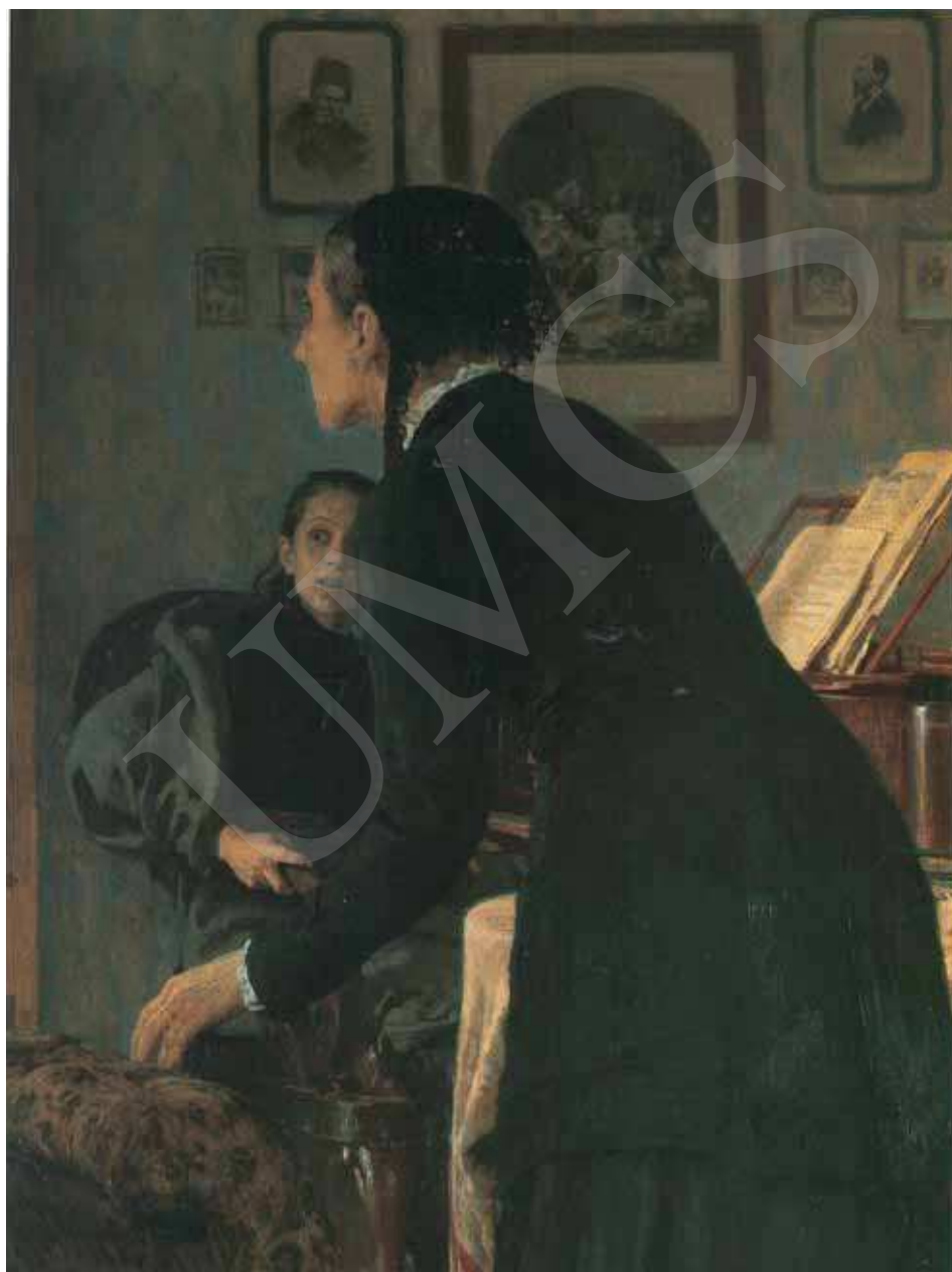
Ilustracja 3. Ilya Riepin, Nie zdali , fragment.