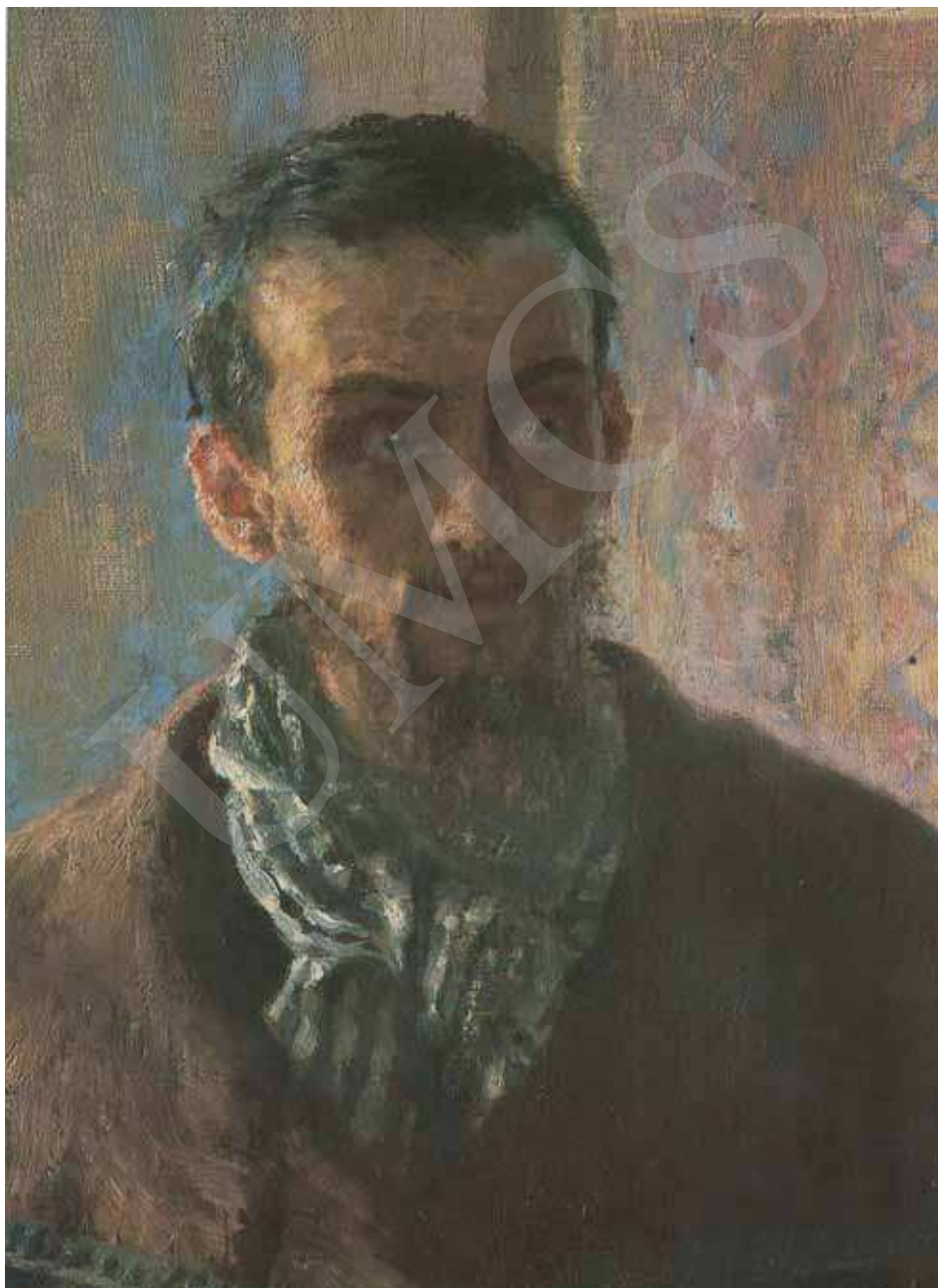
Ilustracja 2. Ilja Riepin, Nie żdali , fragment.