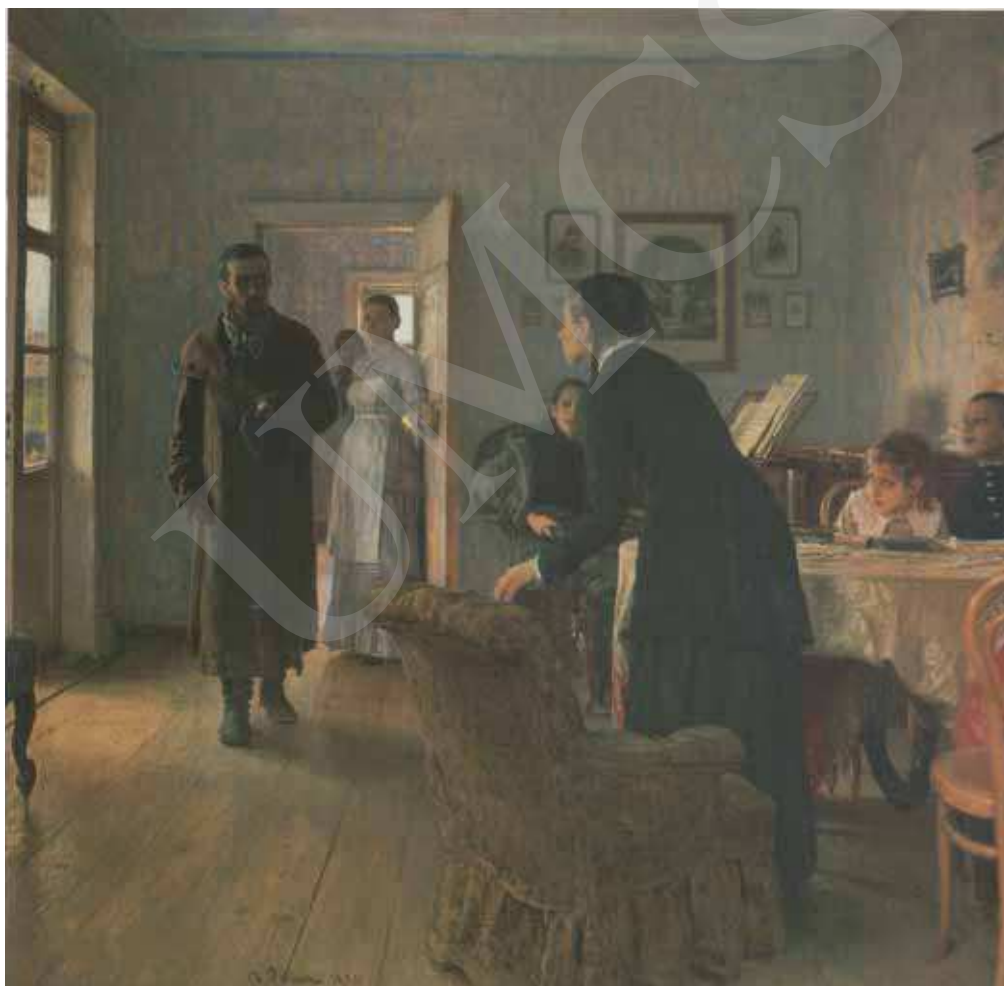
Ilustracja 1. Ilja Riepin, Nie żdali , 1884-1888, olej na płótnie, 160,5cm x 167,5cm.