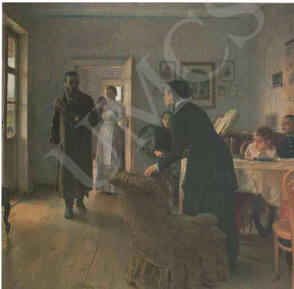
Ilustracja 1. Ilja Rjepin, Nie zdali , 1884-1888, olej na płótnie, 160,5cm x 167,5cm.