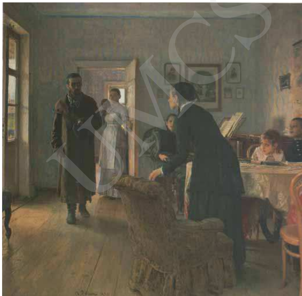
Ilustracja 1. Ilja Riepina, Nie zdali , 1884-1888, olej na płótnie, 160,5cm x 167,5cm.