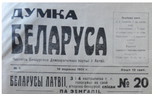
Fot. 12. Fragment strony tytułowej „Dumki Bielarusy”, № 4/1931.