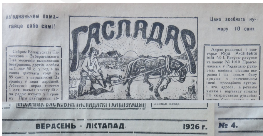
Fot. 4. Górna część strony tytułowej gazety „Haspadar”, № 4/1926.

Z graficznego punktu widzenia na szczególną uwagę zasługuje tytuł gazety z rysunkiem przedstawiającym chłopca z koniem i pługiem podczas pracy na tle pola, chaty i zachodzącego (wschodzącego?) słońca.