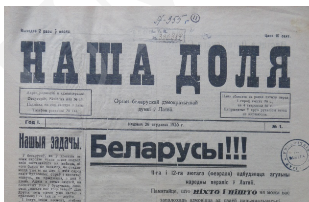
Fot. 8. Fragment tytułowej strony „Нашей Доль”, № 1/1930.

Tematem nadrzędnym gazety były bieżące wydarzenia polityczne i działalność mniejszości białoruskiej na Łotwie, uzupełnione o nowiny z zagranicy, sprawozdania z działalności organizacji i kronikę. Ponadto w kolejnych numerach znajdował się dział „Arataja” z poradami praktycznymi dla gospodarstw wiejskich.