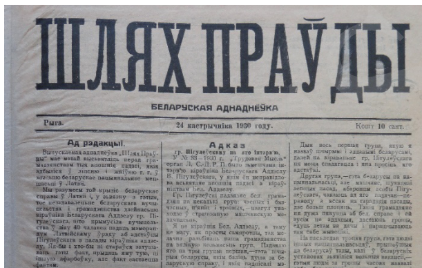
Fot. 9. Fragment strony tytułowej „Шляху праўды”, 24.10.1930.

i na jej łamach podejmowano bieżące wydarzenia z życia politycznego, społecznego Białorusinów Łotwy.