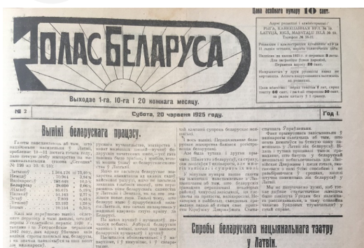
Fot. 3. Fragment strony tytułowej gazety „Hołas bielarusu”, № 2/1925.

W porównaniu z innymi gazetami („Haspadar”, „Bielaruskaja szkoła ŭ Łatwii”), „Hołas bielarusu” był gazetą drukowaną, czarno-białą, o uproszczonej grafice.