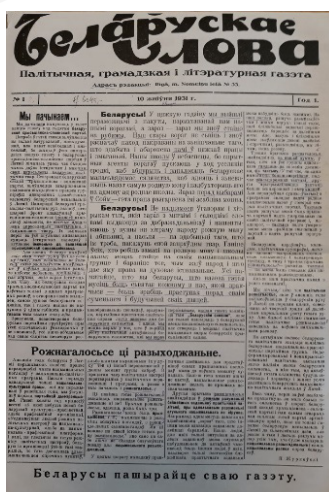
Fot. 13. Strona tytułowa gazety „Bielaruskaje słowa”, № 1/1931.