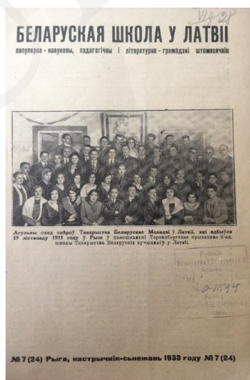
Fot. 7. Strona tytułowa „Беларускай школы ў Латвіі”, № 7(24)/1933.