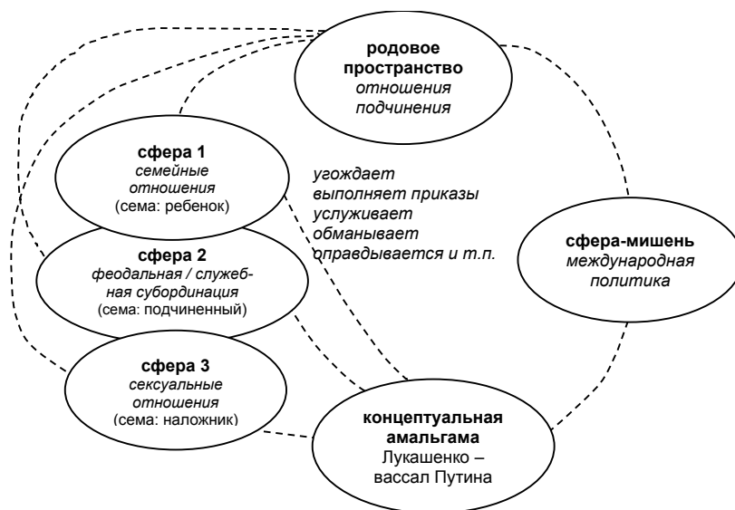
Схема 1. Концептуальная амальгама в мемах „Лукашенко – вассал Путина” (собственная разработка).

Нашей целью является выделение и описание основных слотов репрезентируемой интернет-мемами амальгамы „Лукашенко – вассал Путина”, учитывая связи данного метафорического конструкта с другими фрагментами коллективного когнитивного пространства. Сопоставление серии мемов, генерированных одной исходной политической ситуацией, позволяет выделить семантические компоненты, которые в процессе редупликации и трансформации мема остаются неизменными (подробнее: Belovodskaâ, 2014; Belovodskaâ, 2016, s. 126–127). Именно эти компоненты являются теми смысловыми элементами родового пространства, которые способствуют порождению амальгамного медиаобраза. В рассматриваемом нами случае породившая концептуальную амальгаму сема „подчинения, зависимости, угождения” эксплицируется посредством интеграции сферы политики с концептуальными пространствами других асимметричных (вертикальных) отношений (см. схему 1).