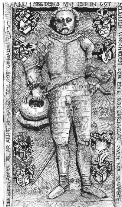
2. Nagrobek przed osobą Franza von Dyherrna, rys. autorstwa M. Kruszewskiej